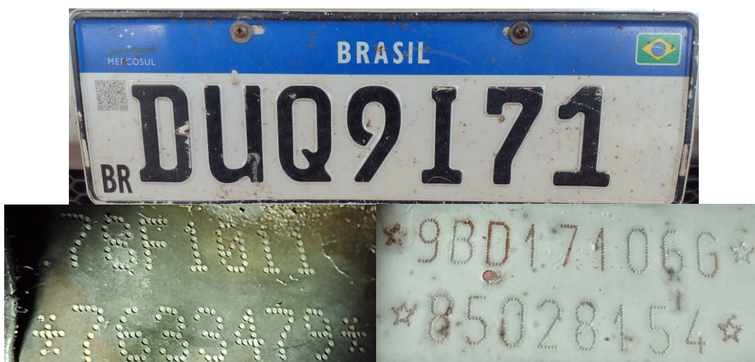
Figura 2 – Dados Identificadores do veículo. Imagens da placa dianteira, nº motor e chassi (verdadeiros)

Após observação dos elementos de interesse pericial, consignam-se, na Tabela 1 e nas Figuras 2 a 7, aqueles que podem fornecer um quadro geral da situação em que se encontrava o veículo examinado.