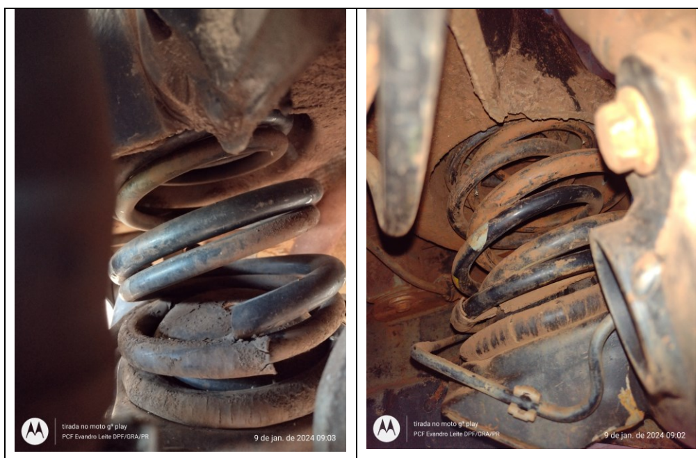
Figura 7: Fotos das suspensões traseira, esquerda e direita

Não foi encontrado radiocomunicador no veículo.