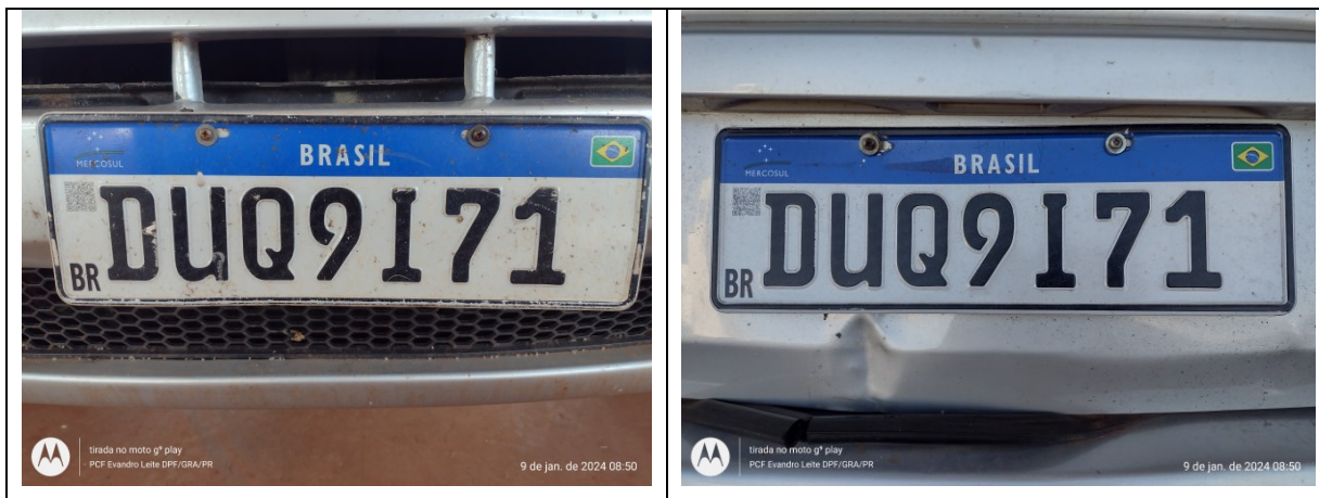
Figura 4: Placas dianteira e traseira (verdadeiras)

Em consulta ao sítio eletrônico da Secretaria Nacional de Trânsito - SENATRAN, foram verificados que os números de série QR Code estampados nas placas supra, dianteira (201198027947866) e traseira (201198027947860) estão devidamente registrados de forma regular.