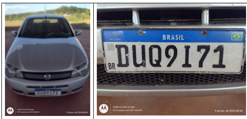
Figura 1: Veículo questionado