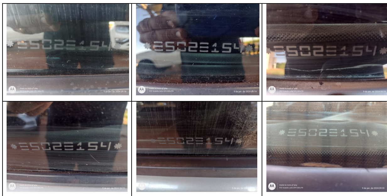
Figura 3: VIS ( Vehicle Identification Section )

Correspondente número VIS ( Vehicle Identification Section ) 3 foram localizados nos diversos vidros.