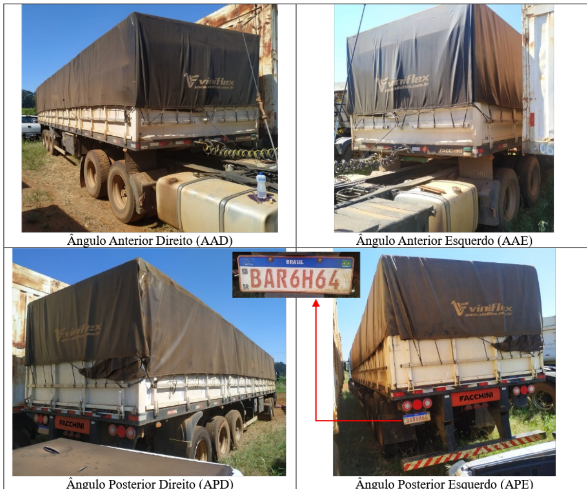
Figura 2: Imagens ilustrativas do VQ-02 (exterior).

Veículo terrestre de carga, tipo Semirreboque, marca FACCHINI, modelo SRF CA, ano fabricação/ ano do modelo 2016/2016, de coloração predominante BRANCA, ostentando as placas identificadoras BAR6H64 (Placa brasileira padrão Mercosul), conforme ilustrado na Figura 2. Na ocasião dos exames o VQ-02 encontrava-se acoplado ao VQ-01.