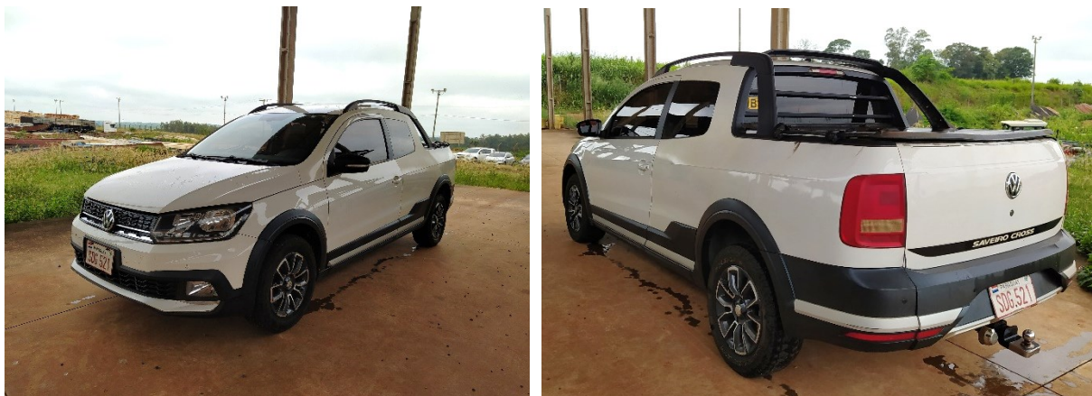
Figura 1 – Imagens do veículo questionado.

O presente Laudo de Perícia Criminal Federal apresenta o resultado dos exames efetuados em um veículo da marca VOLKSWAGEN, modelo SAVEIRO DC CROSS 1.6 TF GPII, placas SDG521 (Paraguay), apresentado na Figura 1. O veículo corresponde ao item 5 do Termo de Apreensão nº 1241320/2024-DPF/GRA/PR.