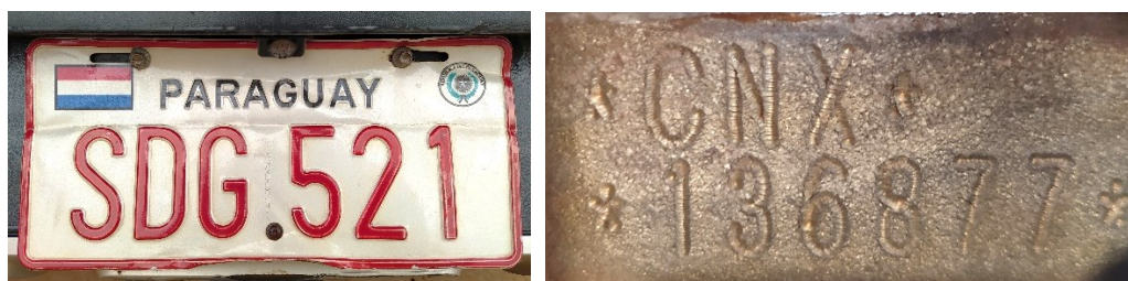
Figura 2 – Dados identificadores do veículo. Placa traseira e nº do motor.