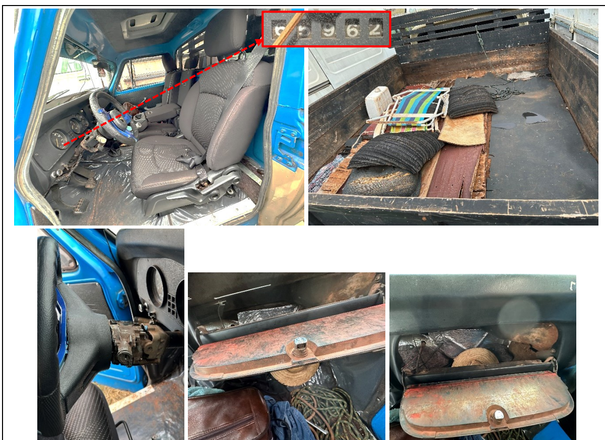
Figuras 11 a 16 – Interior e compartimento de carga do veículo com destaque para o odômetro e parte de trás do volante sem o acabamento e porta luvas sem fundo e sem paredes laterais