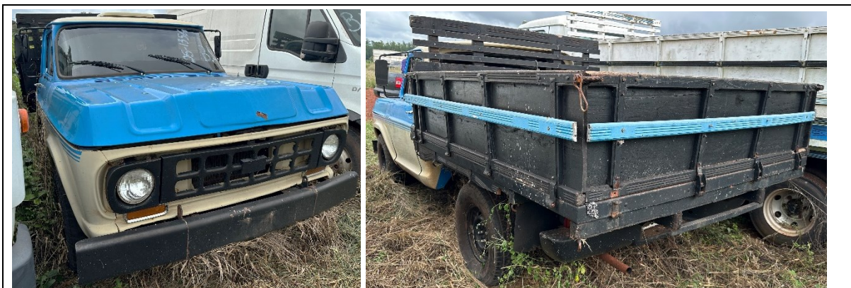
Figuras 1 e 2 – Região diagonal anterior direita e posterior esquerda

Mostrado nas figuras 1 e 2, trata-se de um veículo tipo caminhonete, marca General Motors, modelo Chevrolet D10, cor azul, ostentando placas padrão Mercosul HQH1B71.