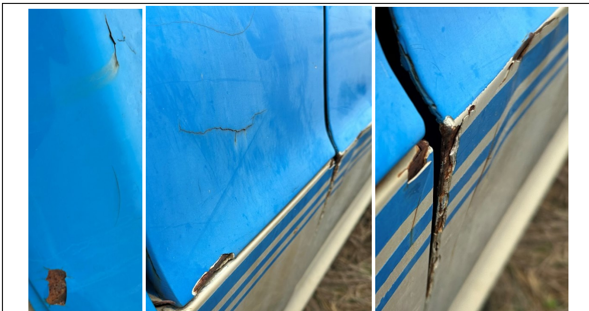
Figuras 17 a 19 – Danos na pintura e lataria