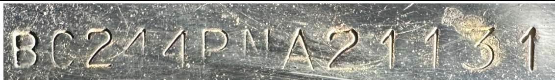
Figura 3 – Número de Identificação Veicular – NIV na face superior do lado direito da parte dianteira longitudinal.

Constatou-se que os caracteres alfanuméricos do NIV (Figura 3) do veículo examinado, gravados em baixo-relevo, apresentava-se com tamanhos e formatos regulares, sem vestígios de adulteração e correspondem aos dados registrados junto à SENASP, para o veículo de placas HQH1B71 (Figuras 5 a 10).