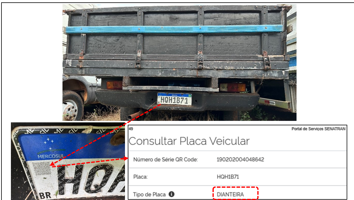
Figuras 8 a 10 – Placa dianteira afixada na traseira do veículo.