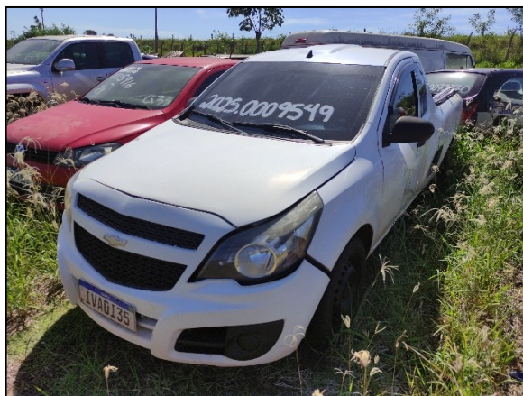
Figura 1 – Vista frontal do veículo examinado.

Trata-se de veículo da marca GM/CHEVROLET, modelo MONTANA LS, pintura na cor BRANCA, ano de fabricação/modelo 2013/2014, que ostentava as placas IVA0135 (padrão Mercosul), registrada do município de IBIPORÃ/PR (Figuras 1 e 2).