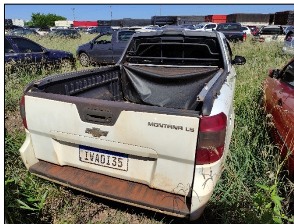
Figura 2 – Vista posterior do veículo examinado.