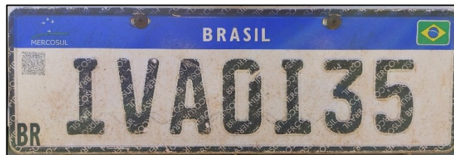
Figura 4 – Placa traseira do veículo examinado.