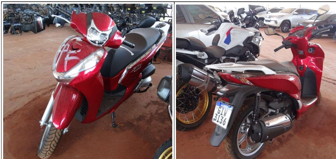
Figuras 1 e 2 – Ilustram o veículo examinado.

Trata-se de uma motoneta da marca HONDA, ilustrada nas figuras 1 e 2, modelo SH 300I, pintura na cor vermelha, ano de fabricação/modelo 2020/2020, de fabricação nacional, utilizando gasolina como combustível e portando placas de licença do Mercosul 1 GIW3I36 do Brasil.