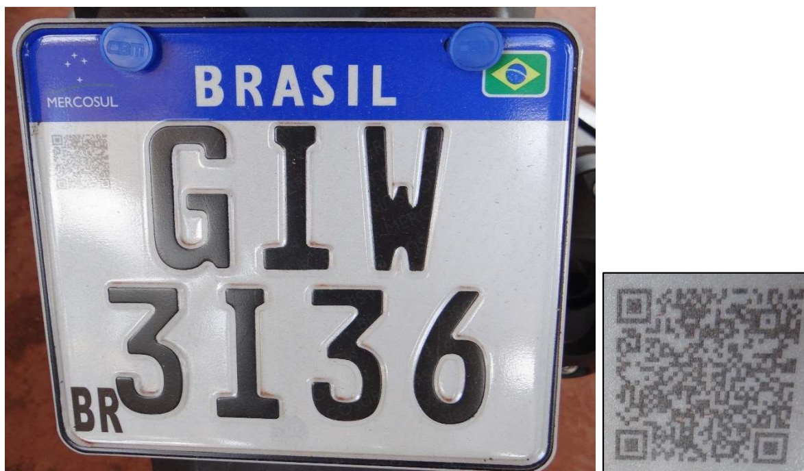
Figuras 3 e 4 – Ilustram a placa do veículo e seu respectivo QR Code .