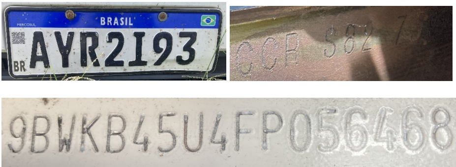
Figura 2 – Imagens da placa dianteira, da numeração do motor e da numeração do chassi