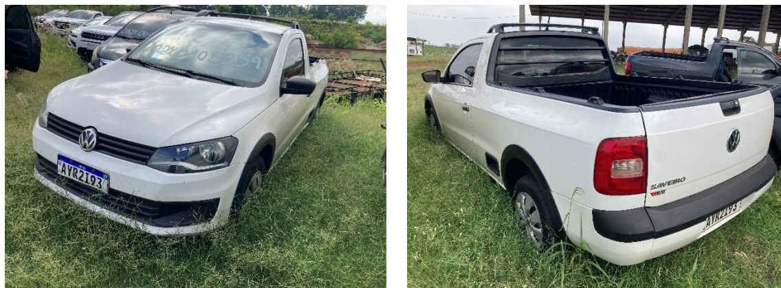
Figura 1 – Imagens do veículo questionado

O presente Laudo de Perícia Criminal Federal apresenta o resultado dos exames efetuados em 01 (um) automóvel marca VW, modelo Saveiro CS TL MB, portando placas AYR2I93, padrão Mercosul, apresentado na Figura 1.