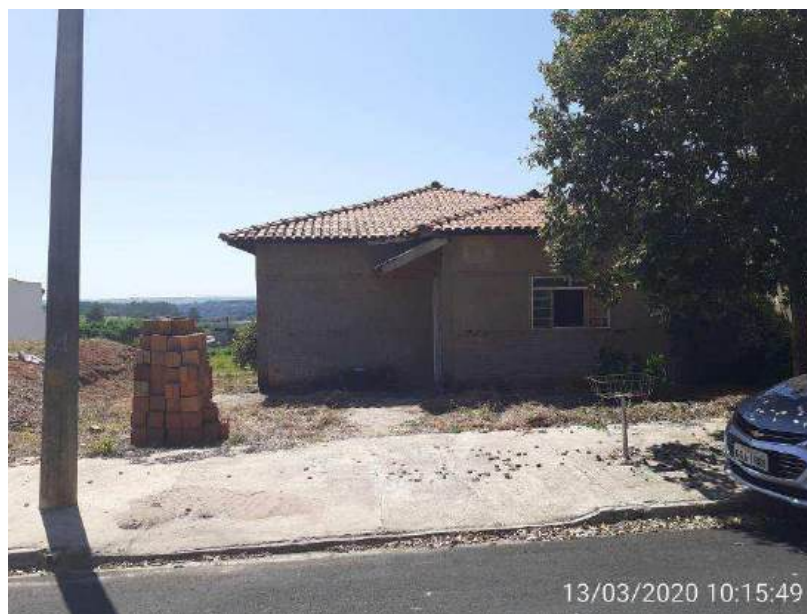
Figura 2-Vista frontal do imóvel

O imóvel compõe-se de lote de um terreno e uma edificação residencial, situada à Rua Artur Esteves de Lima, nº200, Quadra C, Lote 40, Jardim Bela Vista, no Município e Comarca de Monte Alto, Estado de São Paulo.