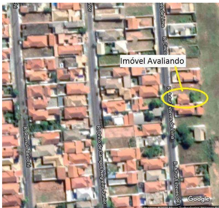
Figura 1-Imagem aérea do imóvel avaliando