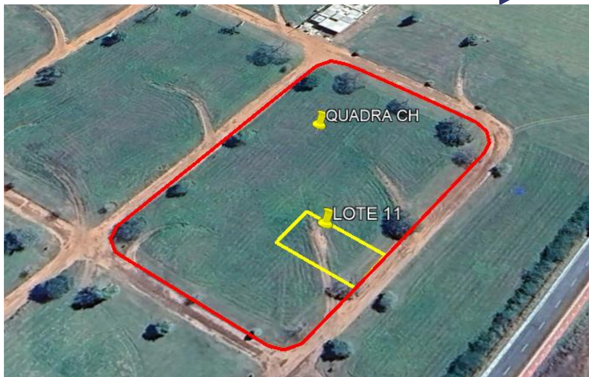
Imagem 3 – Imagem da Quadra e Lote do Imóvel

O lote avaliado, dentro do empreendimento, está localizado a aproximadamente 1500m da Portaria Principal e a aproximadamente 1300m do clube de lazer.