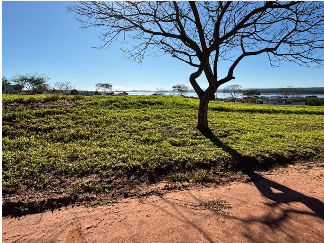
Imagem 10 – Lote 11 Quadra CH