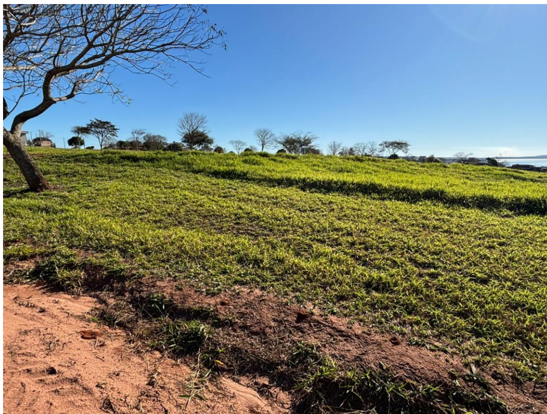
Imagem 11 – Lote 11 Quadra CH – Outra Vista