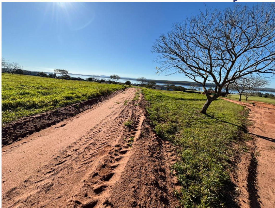
Imagem 12 – Lote 11 Quadra CH em Active + Curva de Nível em seu Interior Fonte: Autor