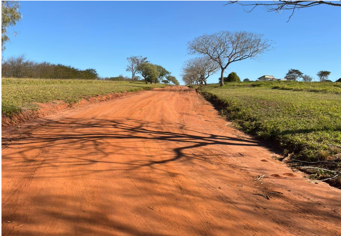
Imagem 8 – Rua 13 sem Pavimentação