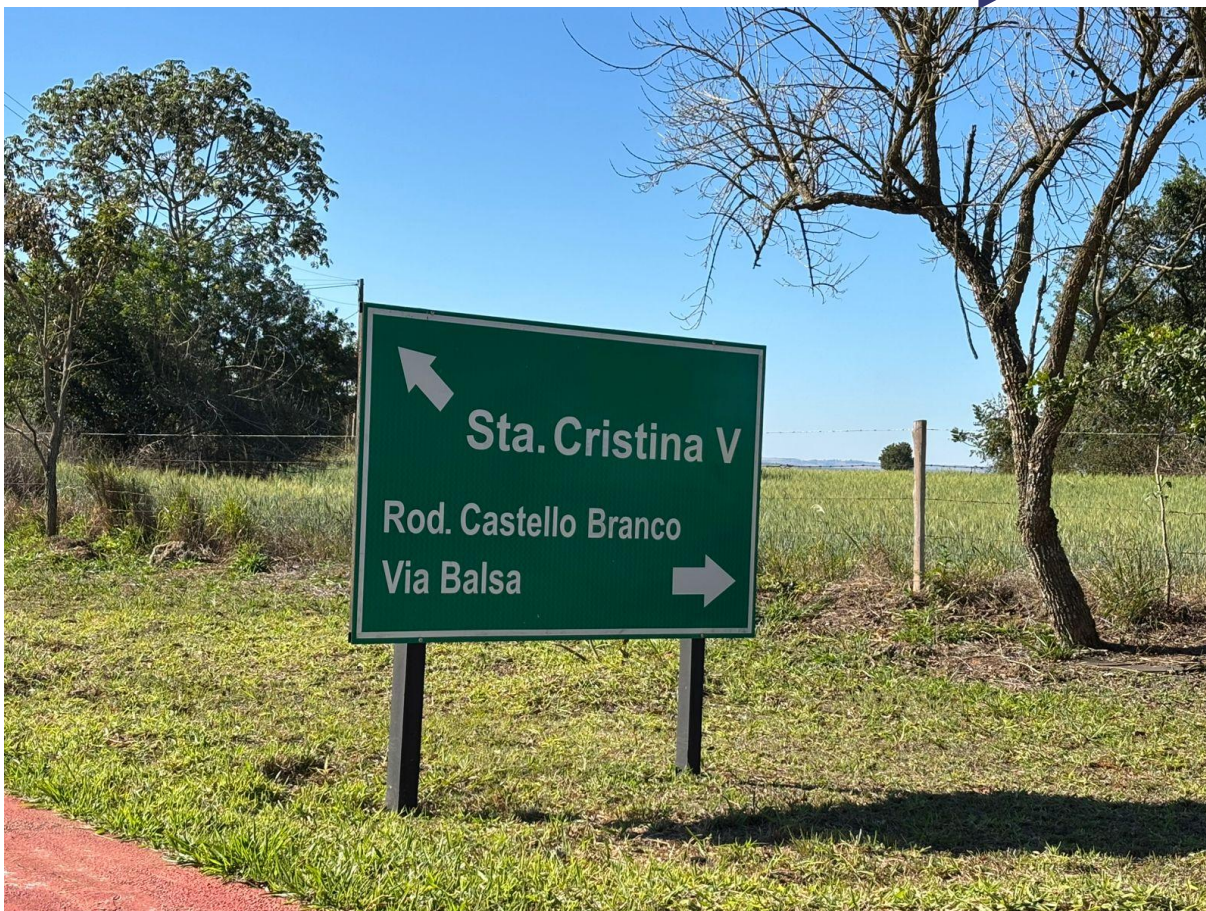
Imagem 6 – Placa de Identificação do Empreendimento