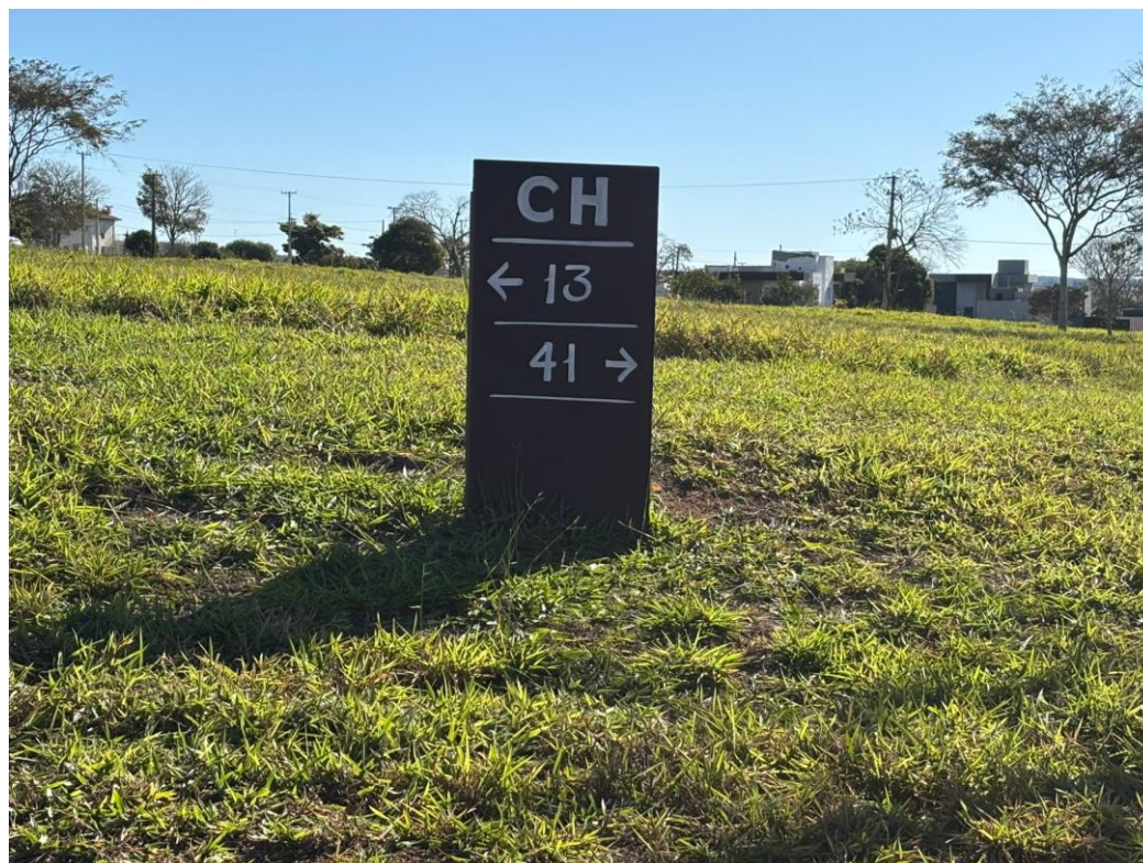
Imagem 7 – Placa de Identificação da Quadra