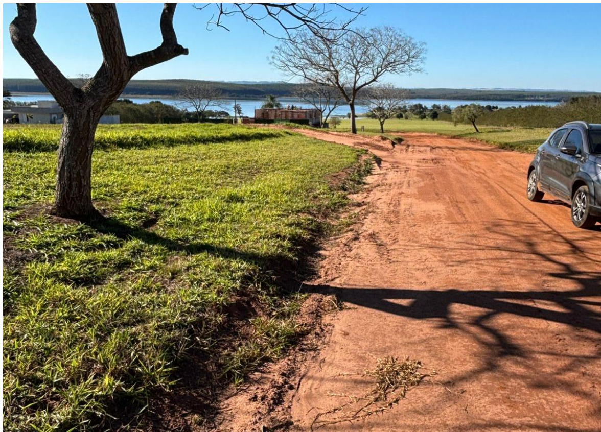
Imagem 9 – Rua 13 sem Pavimentação – Outra Vista (sentido contrário)