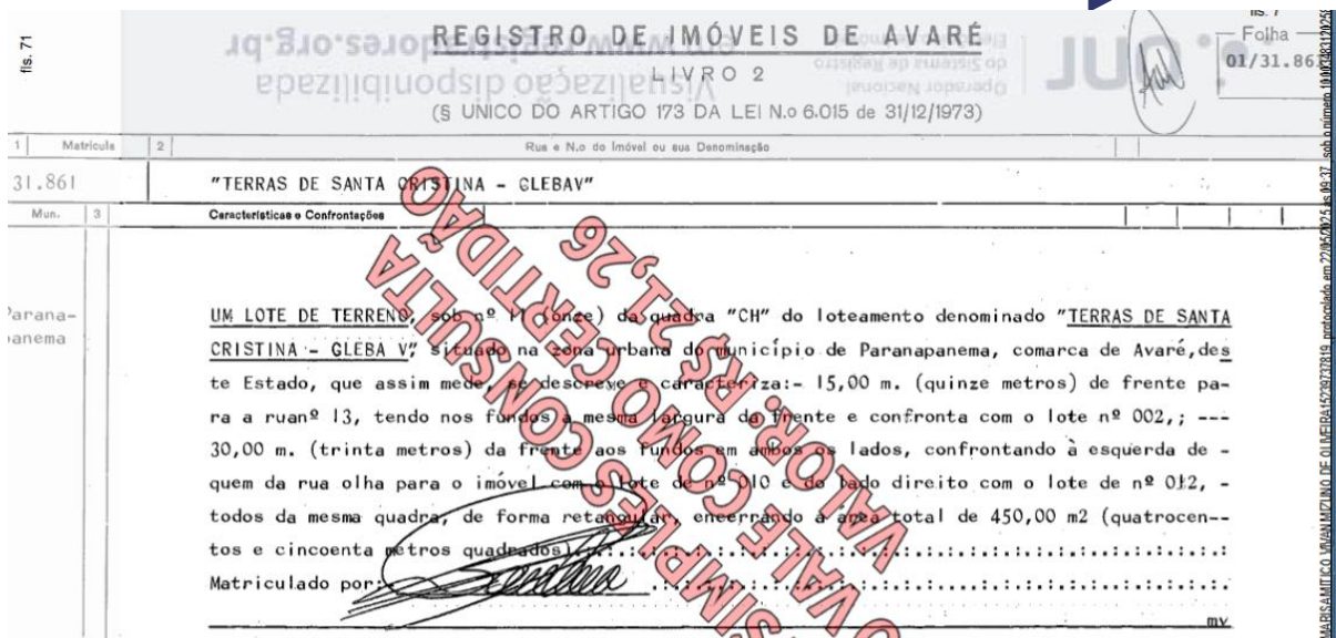
Imagem 5 – Matrícula 31.861 do Cartório de Registro de Imóveis e Anexos da Comarca de Avaré