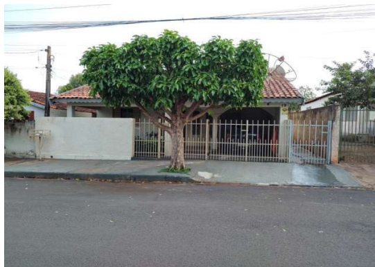
Frente casa principal

FOTOGRAFIAS DA CASA DA FRENTE DA AVENIDA, LATERAL e CORREDOR DE ACESSO A CASA DOS FUNDOS, FEITAS NO DIA DA VISITA: