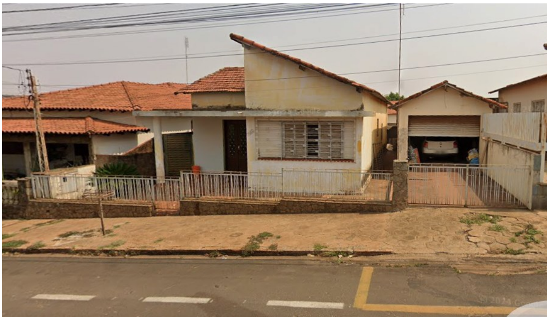
Fotografia do imóvel – Fachada do imóvel.