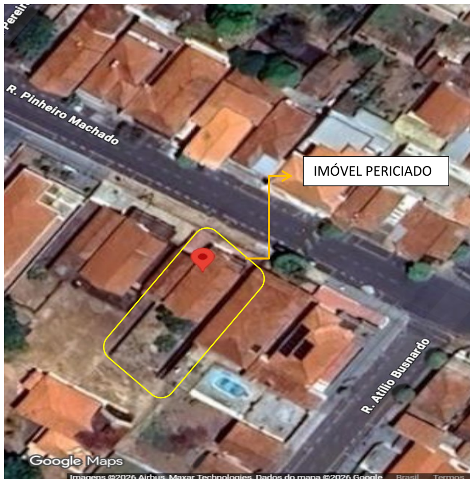
ILUSTRAÇÃO 1 – Localização, fonte google maps 2026.