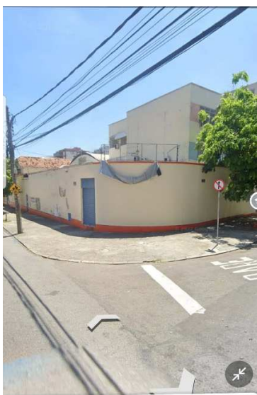
120 R. Vilela Tavares

Rua dos Carijós esquina com Rua Vilela Tavares