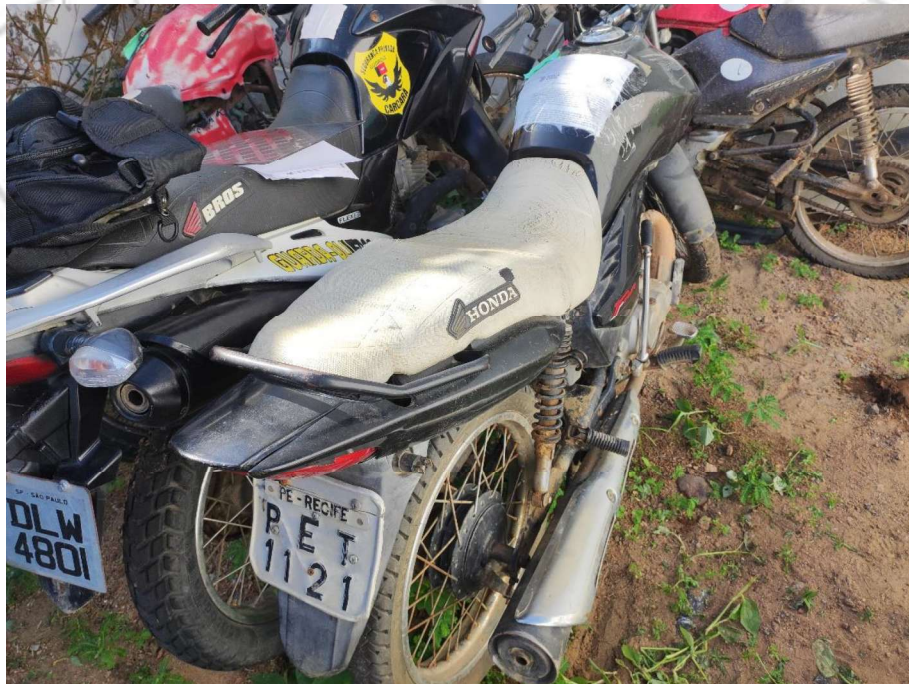
Fotografia ilustrativa de nº 01– Mostra uma visão geral do veículo.

Tratava-se de um veículo motocicleta da marca HONDA, modelo CG 125, cor preta, que apresentava placa de identificação PET – 1121/PE.