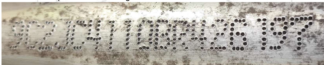
Fotografia ilustrativa de nº 02 – Mostra detalhes da gravação adulterada do NIV observado no veículo.

Isto constatado, foi aplicado no local a devida técnica forense na tentativa de revelar de forma latente os caracteres originais formadores do NIV, no entanto devido aos danos no local quando do procedimento adulterador, não foi possível identificar a sequência do NIV original do veículo.