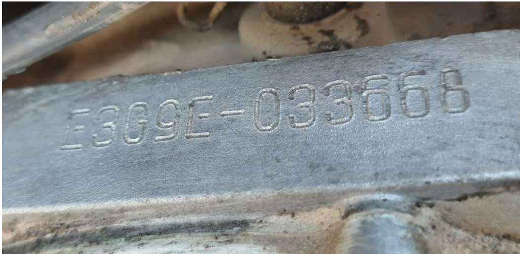
Fotografia ilustrativa 03 – Mostra detalhes da peça suporte e da codificação identificadora do motor.

Quanto à codificação identificadora do motor presente no veículo, a mesma se apresentava sem danos e/ou marcas de adulteração, apresentando os caracteres lá gravados características semelhantes às utilizadas pelo fabricante, ficando assim confirmada a sequência identificadora do motor: E3G9E-033668.