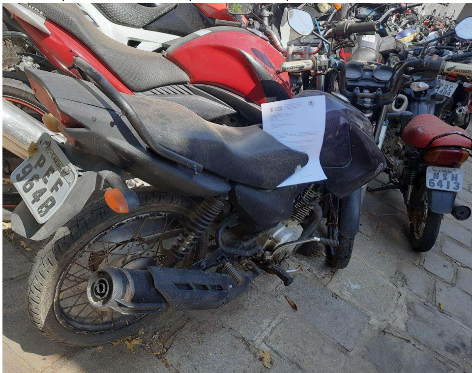
Fotografia ilustrativa 01 – Mostra uma visão geral do veículo.

Tratava-se de uma motocicleta da marca/modelo YAMAHA/FACTOR YBR125, cor predominante roxa, que ostentava a placa de matrícula PEF9648.