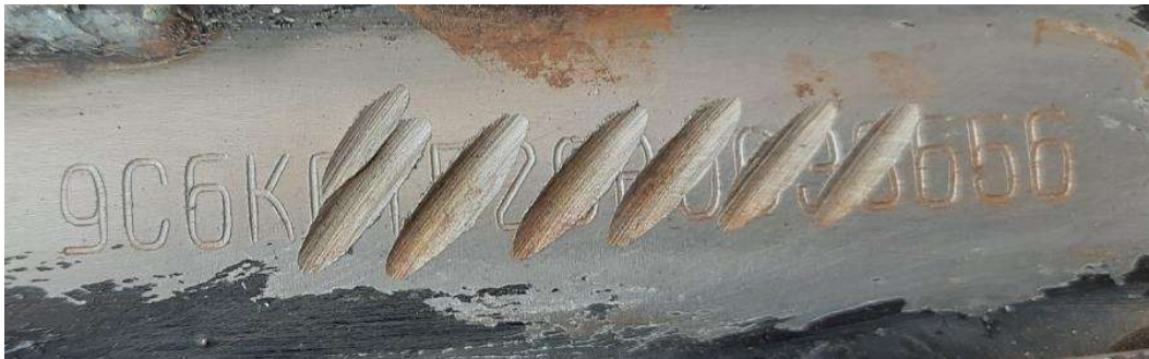
Fotografia ilustrativa 02 – Mostra detalhes da peça suporte e da gravação do NIV danificado.

Após remoção da pintura no local específico e adjacências da gravação do NIV(Número de Identificação Veicular), foi observado e constatado pelo perito marcas de esmerilhamento sobre a peça metálica suporte do NIV, mais precisamente sobre os caracteres da sequência alfanumérica, danificando-os permanentemente. Isso posto, foi utilizado reativo químico específico sobre a superfície de gravação do NIV na tentativa da identificação da sequência de caracteres, finda a qual foi possível identificar com clareza os dezessete caracteres da sequência, ou seja, 9C6KE1520B0033656.