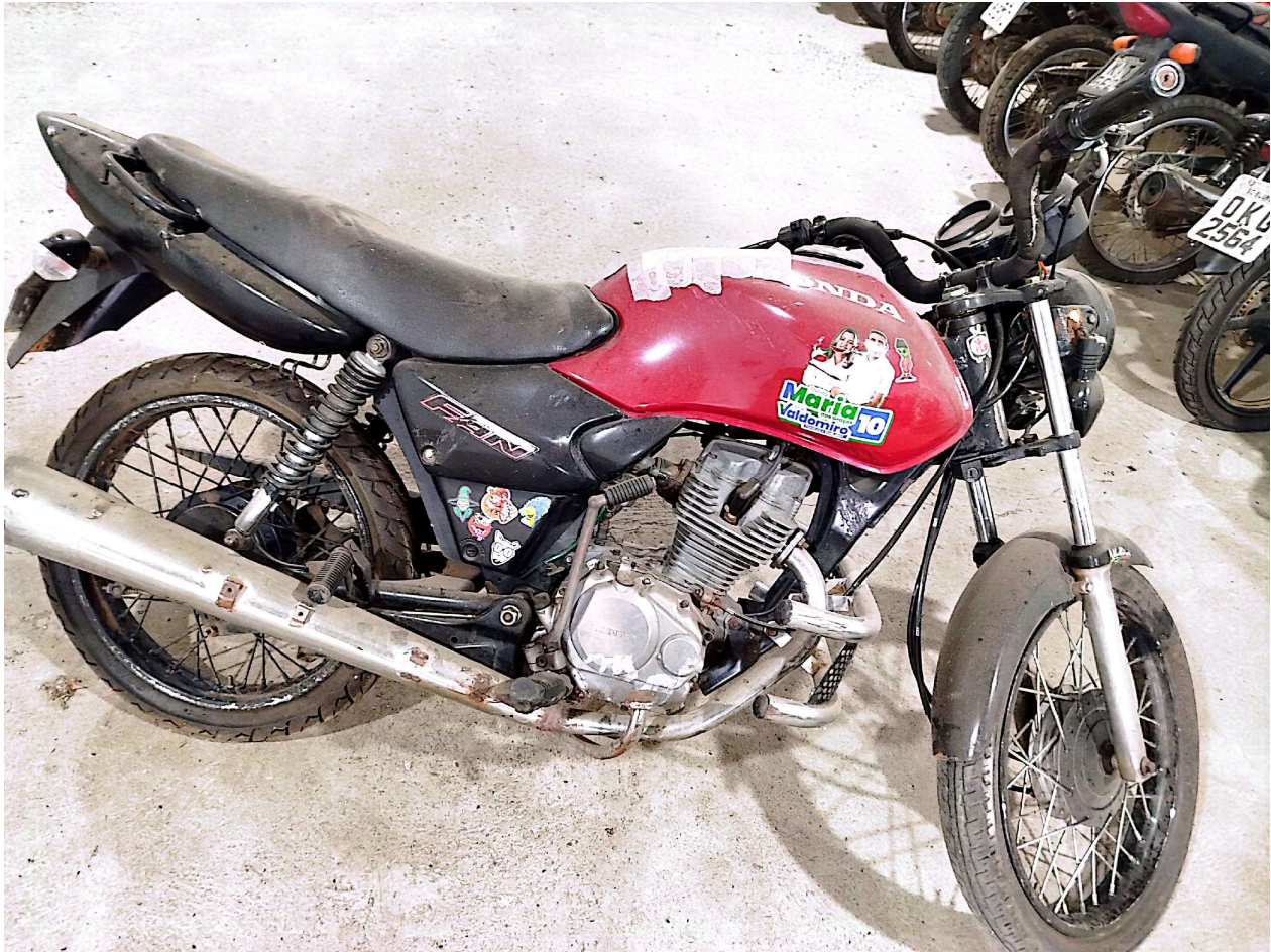
Digitalizado com CamScanner