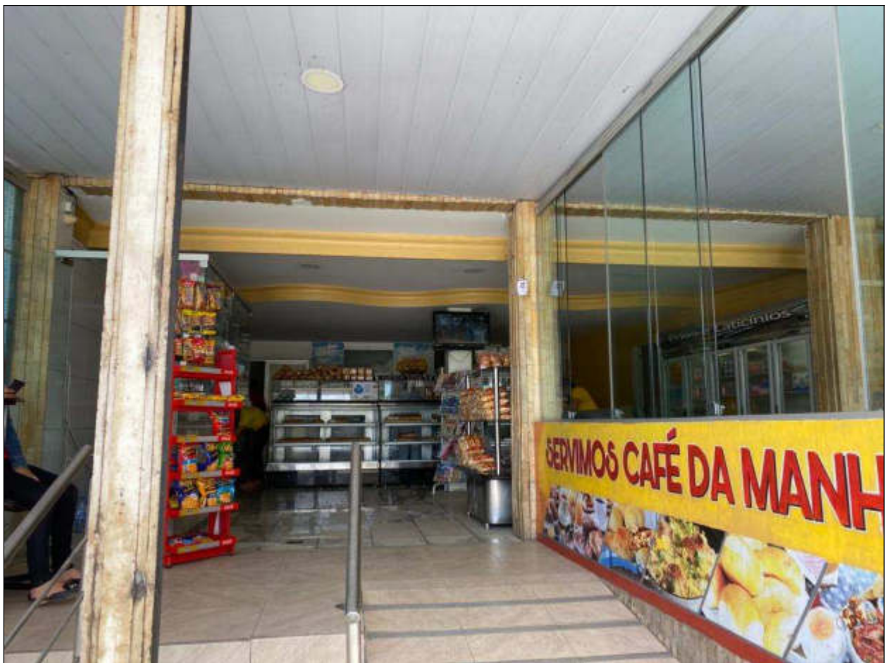
Figura 3 - ponto comercial em funcionamento antes da desocupação