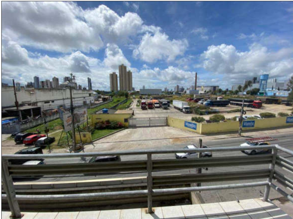
Figura 57 – terceiro pavimento - vista da varanda