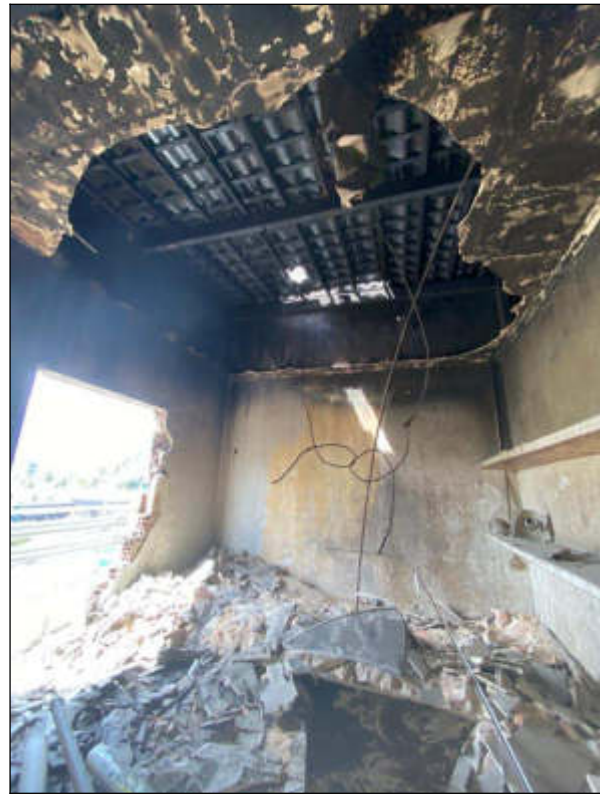
Figura 13 e 14 - terceiro pavimento - instalações