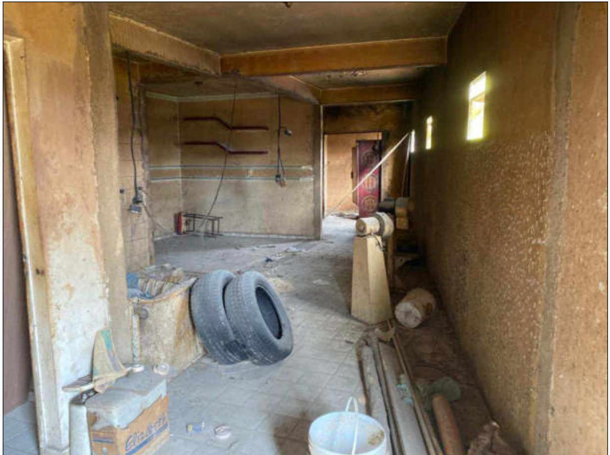
Figura 6 - segundo pavimento