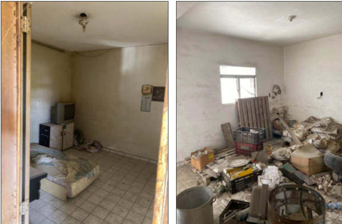
Figura 7 e 8 - segundo pavimento: salas 01 e 02