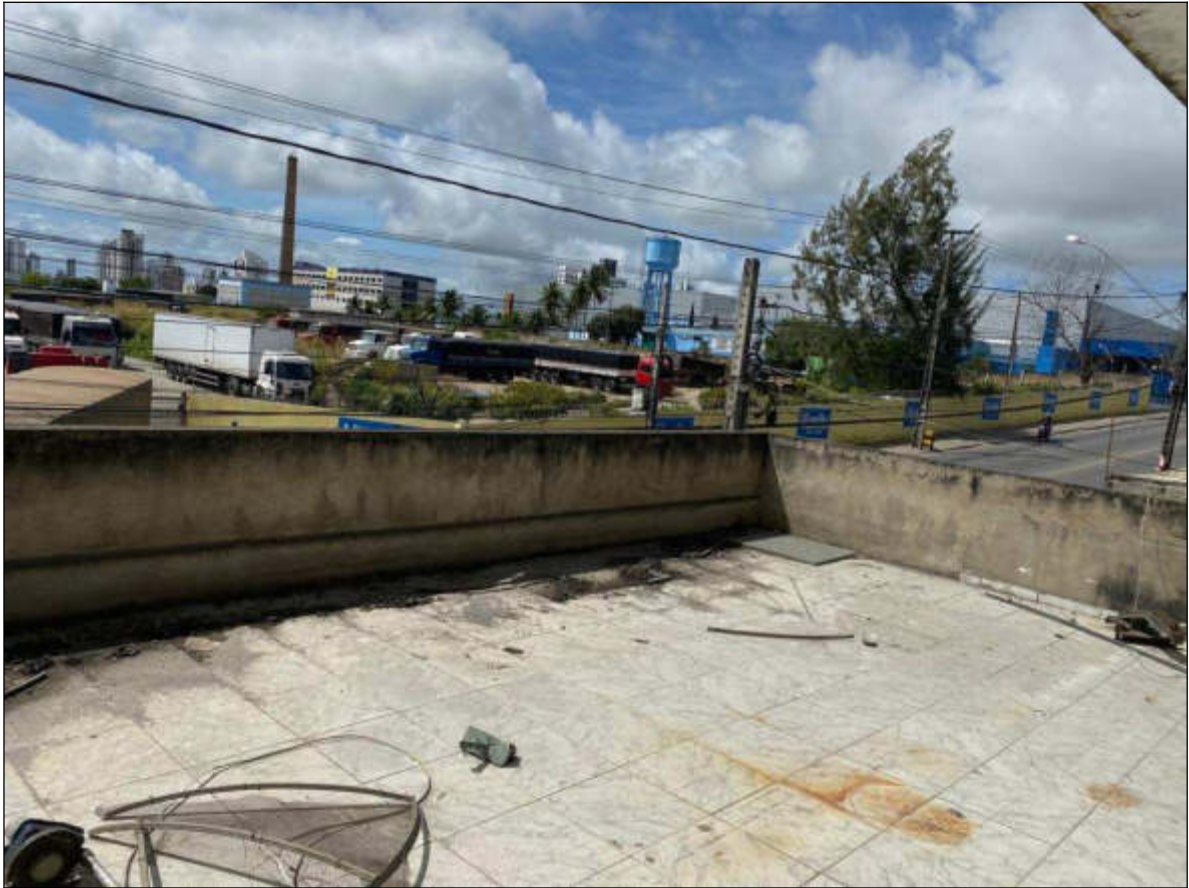
Figura 10 - segundo pavimento: área externa