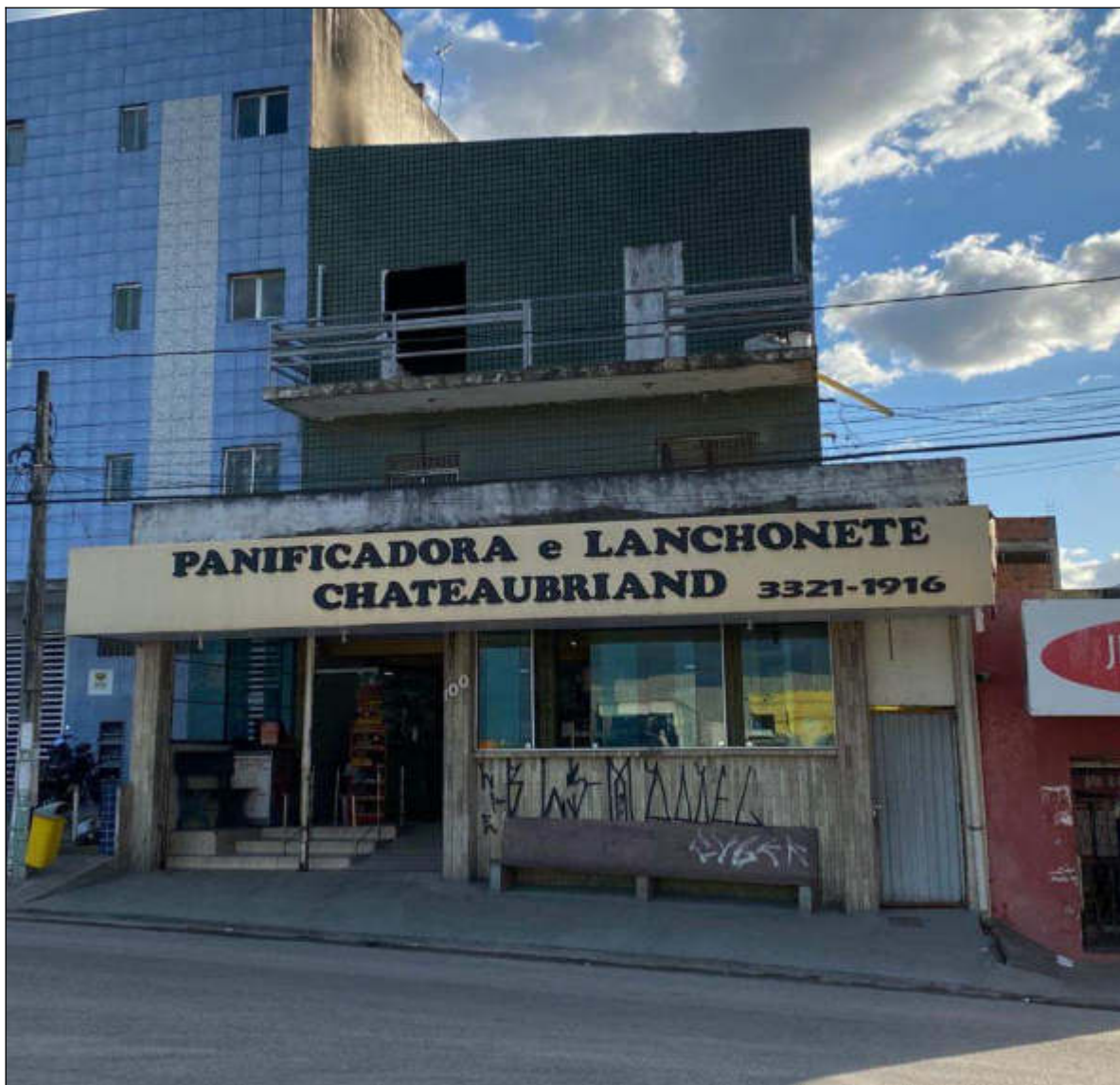
Figura 1- fachada do imóvel antes da desocupação