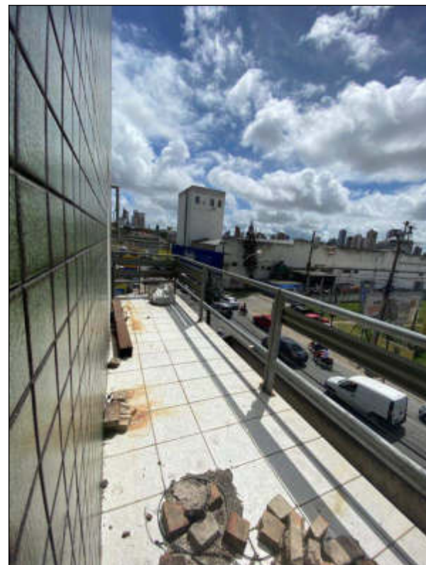
Figura 15 e 16 - terceiro pavimento - acesso à varanda