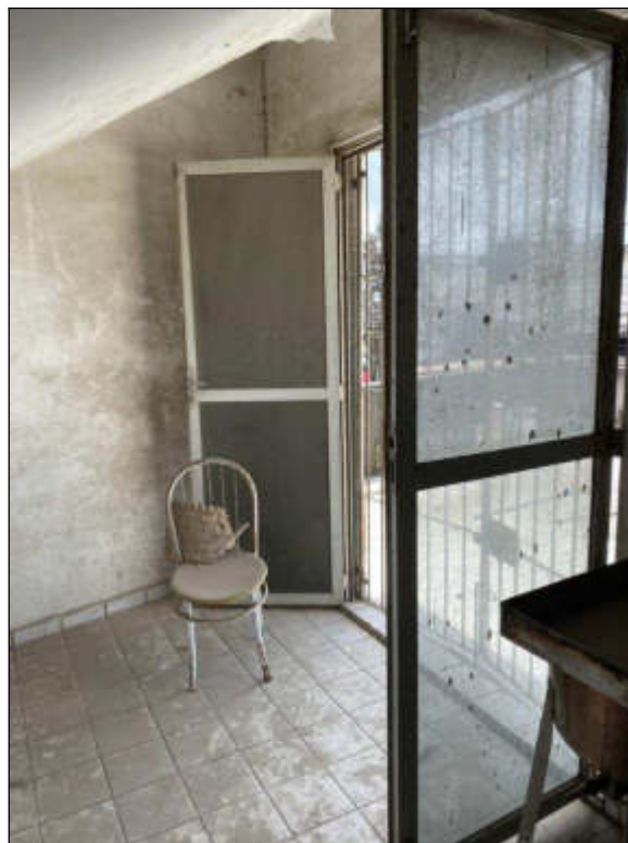
Figura 9 – segundo pavimento: sala 02 - acesso a área externa