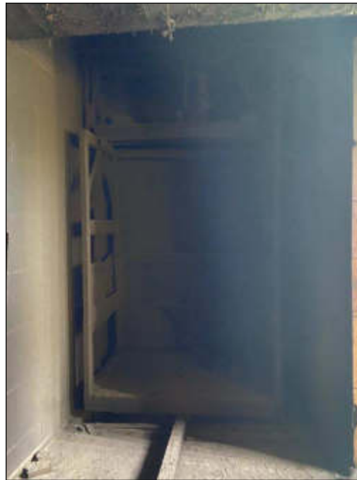
Figura 19 - terceiro pavimento - elevador