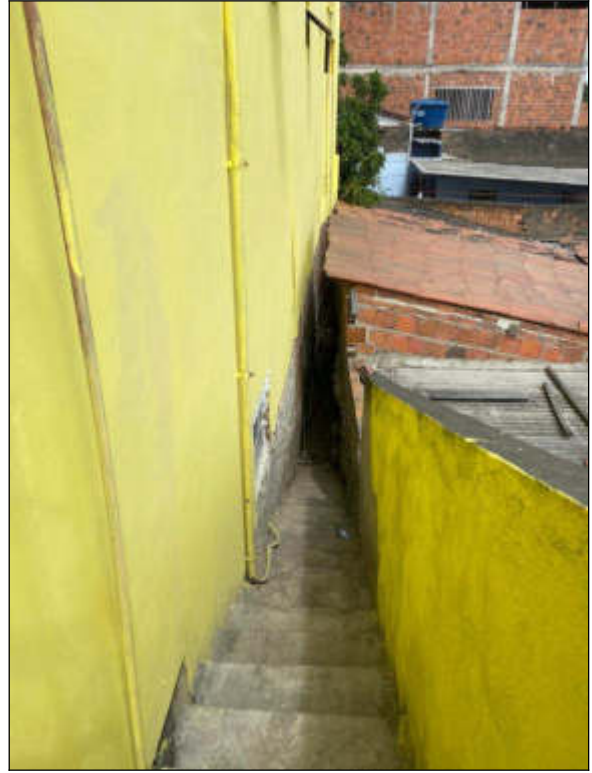
Figura 4 e 5 – corredor lateral com escada de acesso aos pavimentos superiores