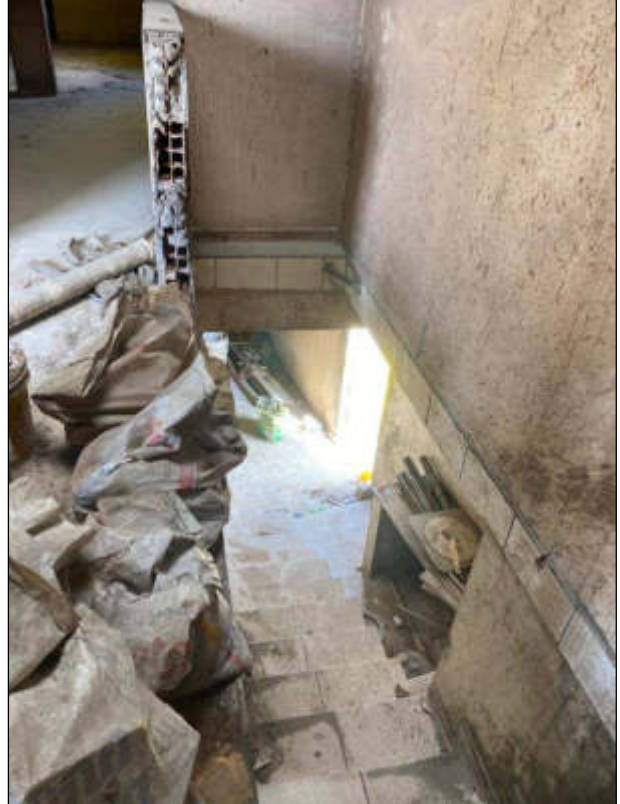
Figura 11 e 12 - escada de acesso ao 3º pavimento