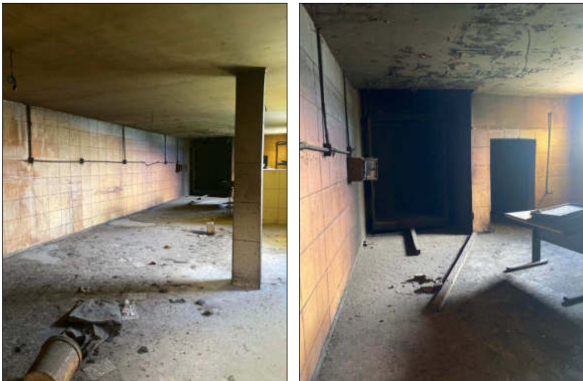
Figura 68 - terceiro pavimento - instalações