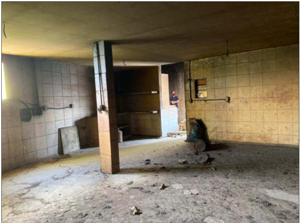
Figura 20 - terceiro pavimento - instalações