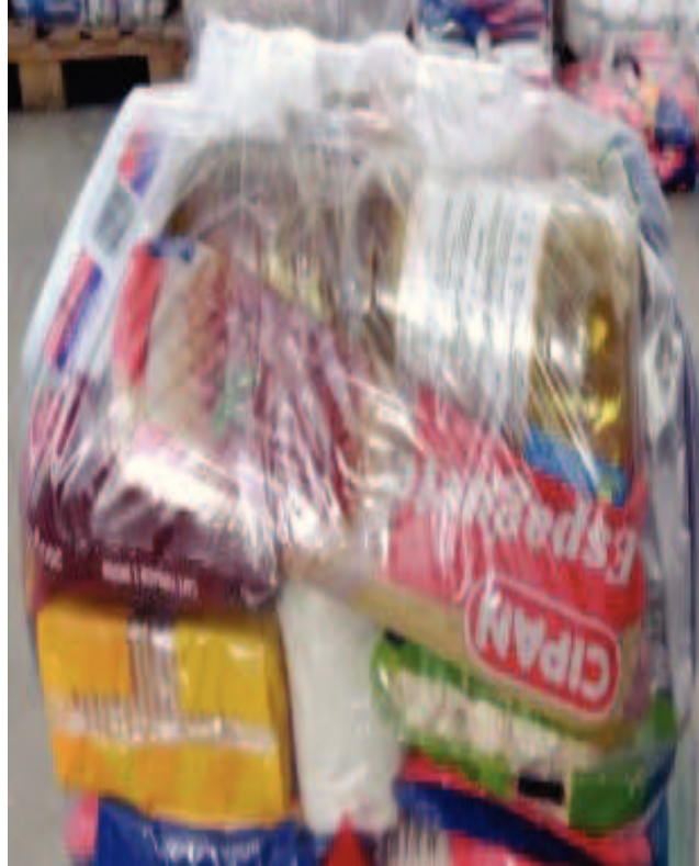
Cesta de alimentos