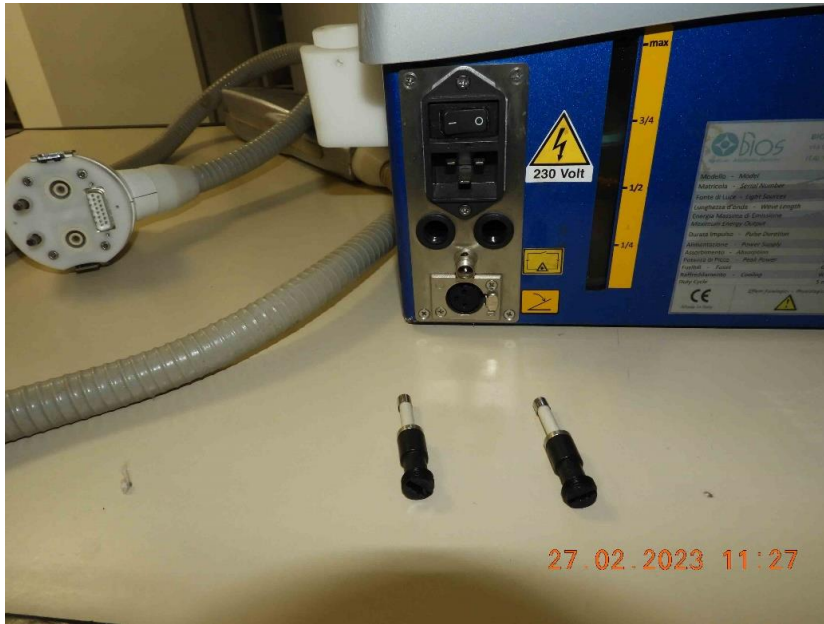
Foto 53 – Vista dos fusíveis do equipamento, estes não estavam atuados e se encontravam adequadamente instalados.