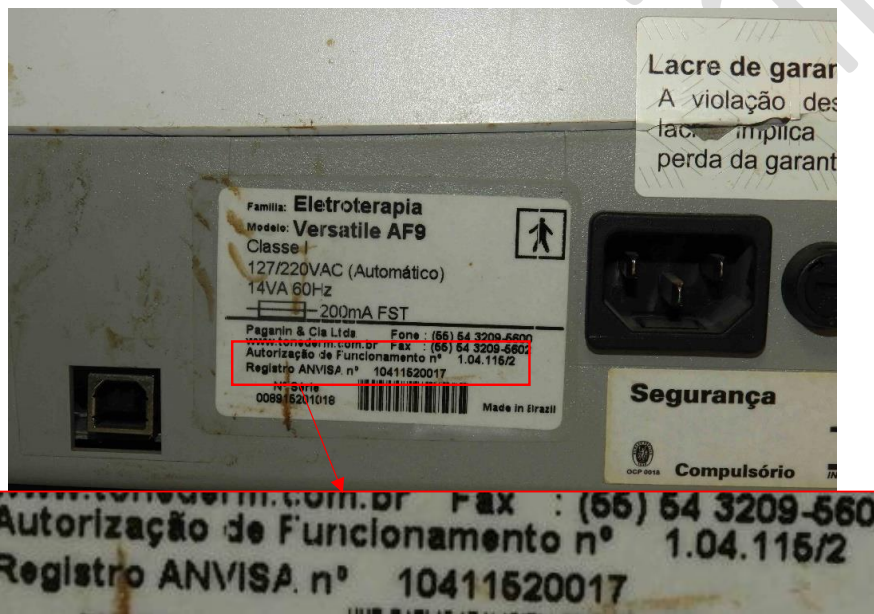
Foto 60 – Vista do equipamento já avaliado, neste podemos notar que diferente dos demais possui nº de Registro da Anvisa, este 10411520017, além da autorização de funcionamento nº 1.04.115/2.