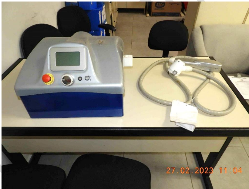
Foto 44 - Vista geral do equipamento Luz Pulsada.