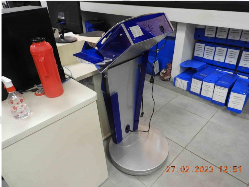
Foto 2 – Vista de como os equipamentos a serem avaliados foram encontrados.