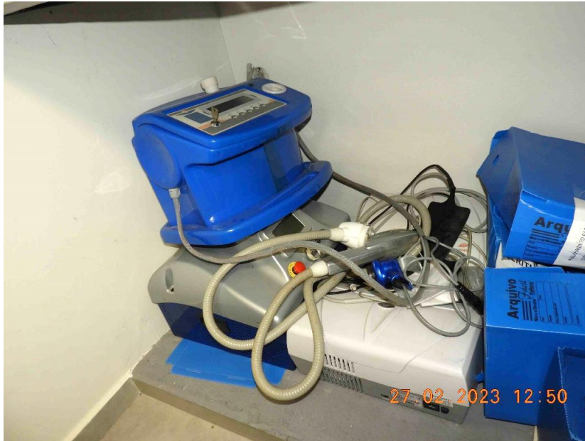
Foto 1 – Vista de como os equipamentos a serem avaliados foram encontrados.

A seguir, serão apresentadas as fotos obtidas durante a perícia de avaliação, que foi realizada no dia 27/02/2023 as 10h.