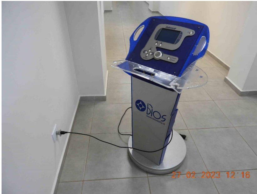
Foto 43 – Vista da realização do teste, onde o equipamento liga a ventoinha, pisca o painel, mas não inicia.