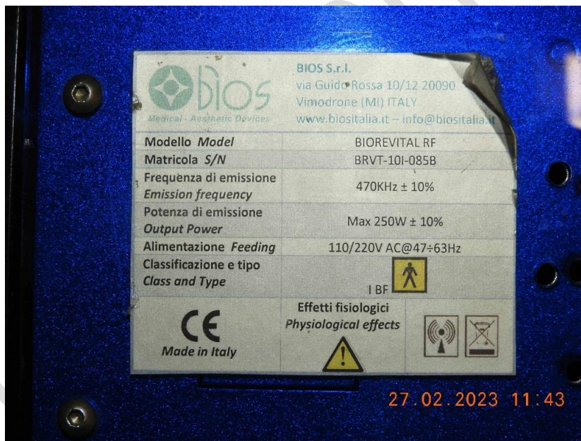
Foto 28 – Vista da etiqueta do equipamento que está em italiano e inglês, com as seguintes informações: Equipamento Radio Frequência, Modelo: BIOREVITAL RF, Nº Serie: BRVT.10I-085B, alimentação 110/220V / 47-63Hz , fabricado em 2010 na Itália pela Bios S.r.l.