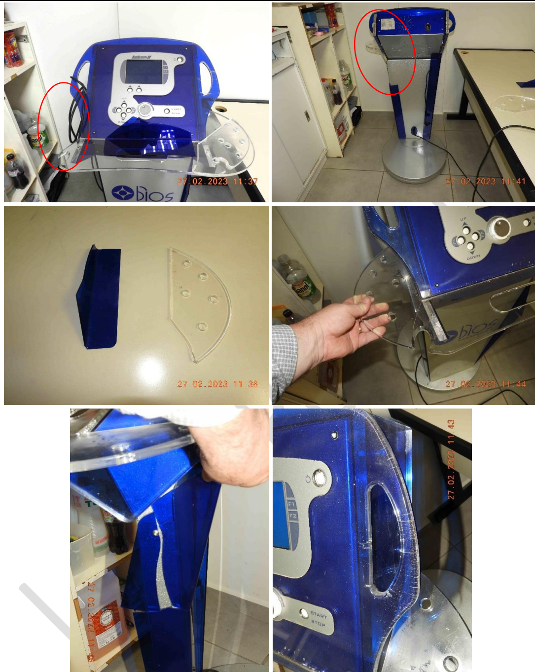
Fotos 21 a 26 – Vista aproximada do equipamento, onde é possível notar que a pedaços do acabamento em acrílico quebrados.

Documento assinado digitalmente, conforme MP nº 2.200-2/2001, Lei nº 11.419/2006, resolução do Projudi, do T.JPR/OE Validação deste em https://projudi.tjpr.jus.br/projudi/ - Identificador: PJDYF-RF38E-YTCBY-SUXHA