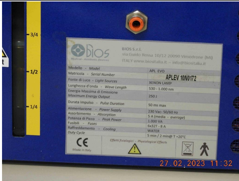
Foto 51 - Vista da etiqueta do equipamento que está em italiano e inglês, com as seguintes informações: Equipamento Luz Pulsada, Modelo: APL EVO, Nº Serie: APLEV 10N0172, alimentação 230V / 50-60Hz, fabricado em 2010 na Itália pela Bios S.r.l.