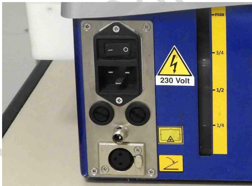
Foto 52 – Vista da entrada de energia e do cabo e aplicação, não foi apresentado o cabo de alimentação, motivo pelo qual não foi possível testá-lo, uma vez que não é um padrão comum.