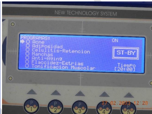
Fotos 13 a 16 – Vista da realização de teste de ligação, onde verificou-se que o memo está ligando.