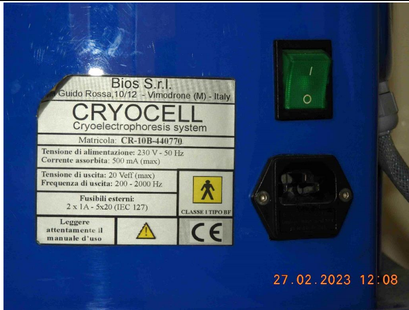
Foto 9 – Vista da etiqueta do equipamento que está em italiano, com as seguintes informações: Equipamento CRYOCELL Nº Serie: CR-10B-440770, alimentação 230V / 50Hz / 500 mA , fabricado em 2010 na Itália pela Bios S.r.l.