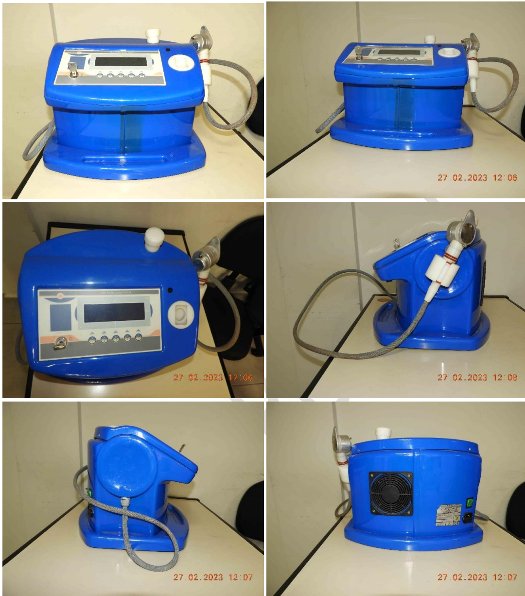
Fotos 3 a 8 – Vista geral do equipamento Cryocell, nota-se ausência do selo da Anvisa.