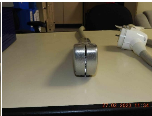
Fotos 54 a 57 – Vista cabo de aplicação, este apresenta danos por queda.

Documento assinado digitalmente, conforme MP nº 2.200-2/2001, Lei nº 11.419/2006, resolução do Projudi, do T.JPR/OE Validação deste em https://projudi.tjpr.jus.br/projudi/ - Identificador: PJDYF-RF38E-YTCBY-SUXHA