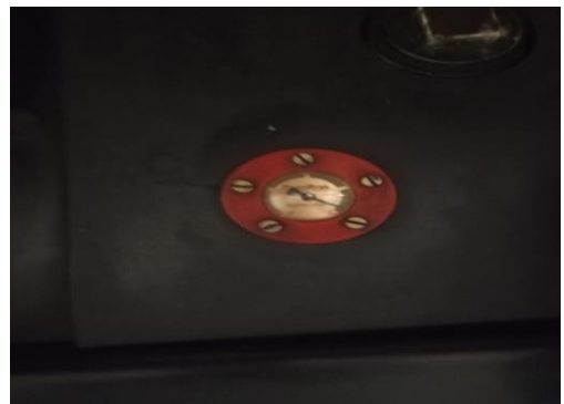
Tanque de combustível