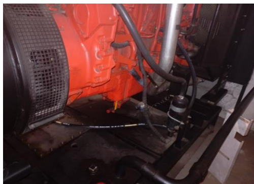
Lado direito do motor