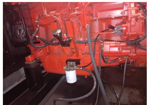
Lado esquerdo do motor