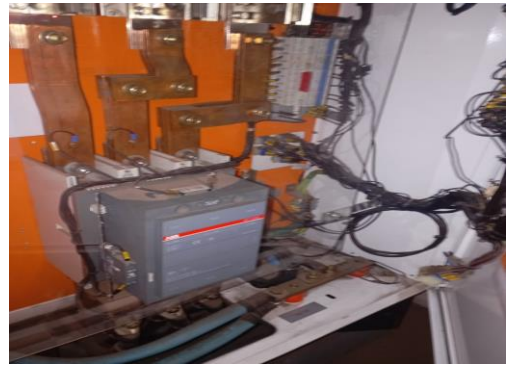
Painel de transferência aberto