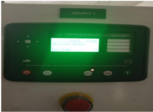
Supervisão do motor (PLC)