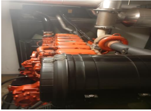
Parte superior do motor