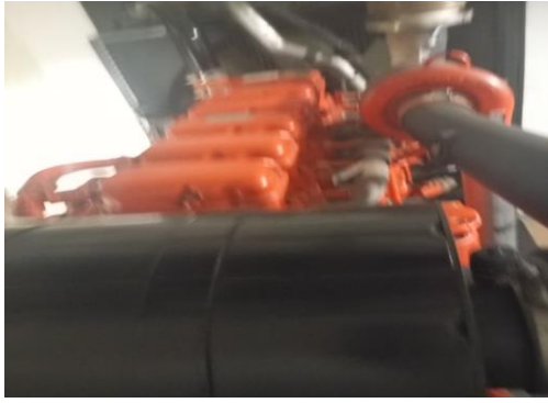
Parte superior do motor