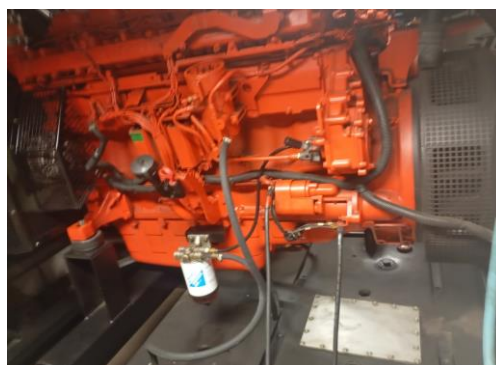
Lado esquerdo do motor