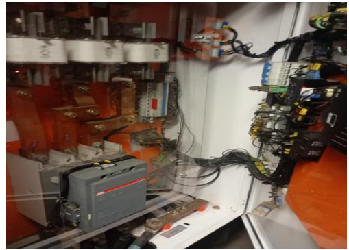
Painel de transferência aberto