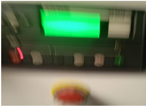
Supervisão do motor (PLC)