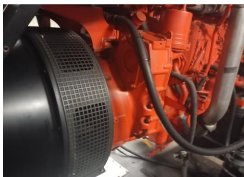
Lado direito do motor