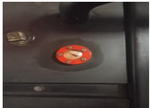
Tanque de combustível