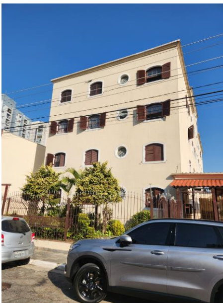
Vista parcial da entrada do imóvel

Dirigindo-se à Rua Tujuguaba, 70, por três vezes, em horários diferentes, este signatário não obteve êxito na localização dos moradores, foi deixado recado por escrito, informando o número do processo, foro, e vara, telefone celular, e não houve retorno dos moradores, não foi possível vistoria interna do imóvel.