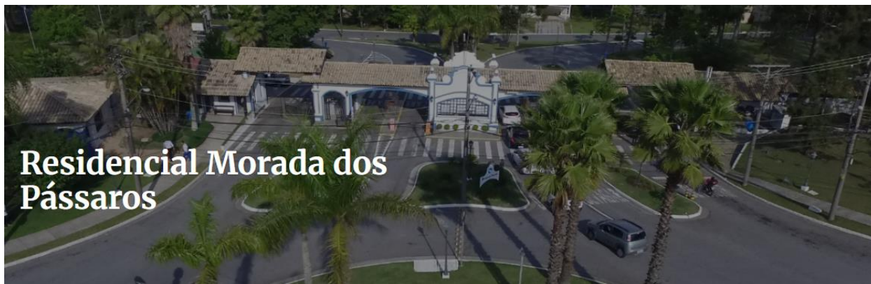
Portaria do Condomínio