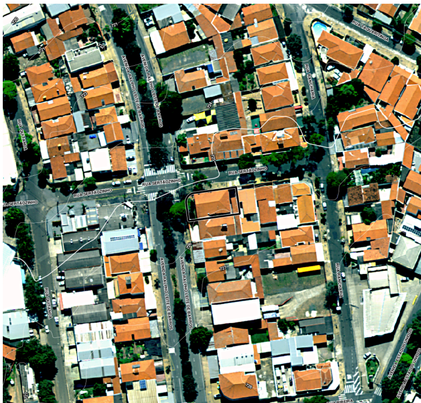
Ortofoto IGC Abr/2023 - Situação sem escala