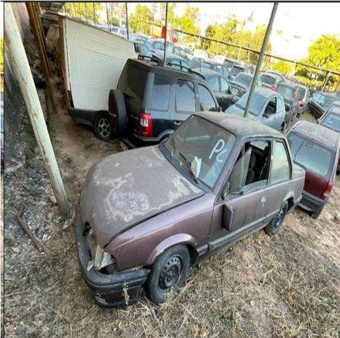
Figura 01- Ilustra o veículo examinado.

Automóvel, placa GMW1093 CAETÉ / MG, marca/modelo GM/MONZA SL/E 1.8, ano 1991, modelo 1991, cor Vermelha, categoria Particular