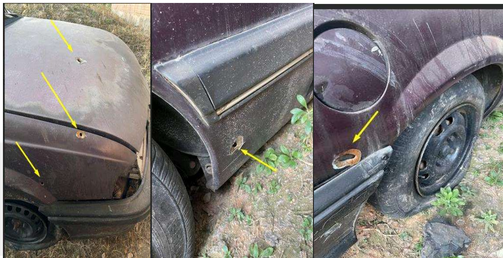
Figura 02- Ilustra as perfurações localizadas na lataria do veículo

Foram localizadas perfurações no veículo, compatíveis com as produzidas por disparos de arma de fogo.( vide figura 02)