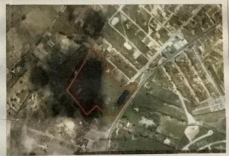
NAPA DE LOCALIZAÇÃO