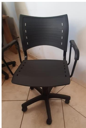
VIII – Cadeira preta giratória p/ escritório (assento e encosto plásticos)