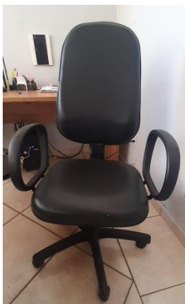
II – Cadeira giratória para escritório cor preta