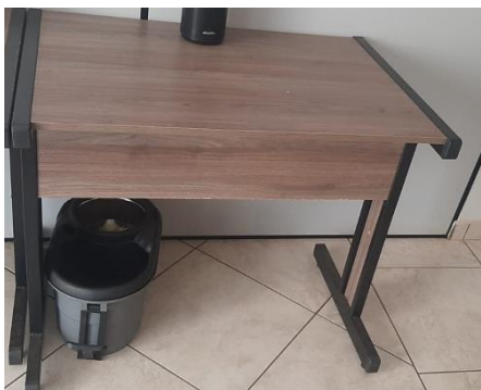
III – Mesa de apoio para escritório