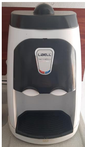
VI – Purificador de água Libell hermético (natural/gelada)