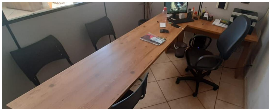
XI – Mesa de madeira grande em “L” para escritório (não desmontável)