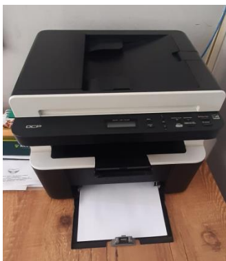
I – Impressora Multifuncional Brother modelo DCP-1617NW