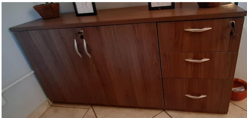
XII – Rack para escritório com duas portas e três gavetas