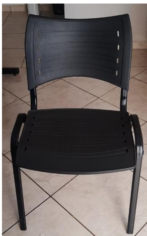
IV – 3 Cadeiras para escritório cor preta com assento e encosto plásticos