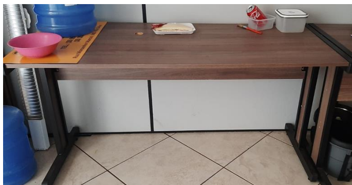
V – Mesa para escritório