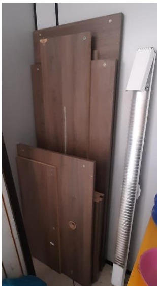
X – 3 mesas em “L” (estações de trabalho) para escritório (desmontadas)