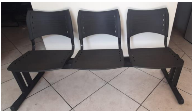
IX – Longarina para espera com 3 lugares