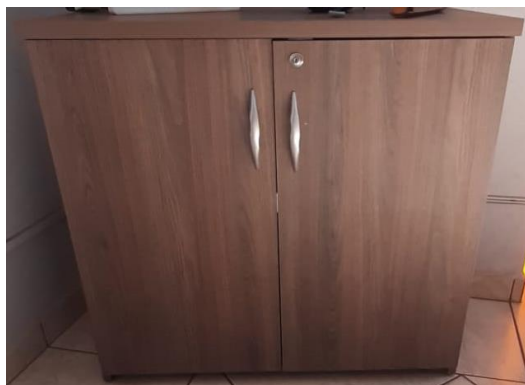
VII – Armário pequeno para escritório 2 portas