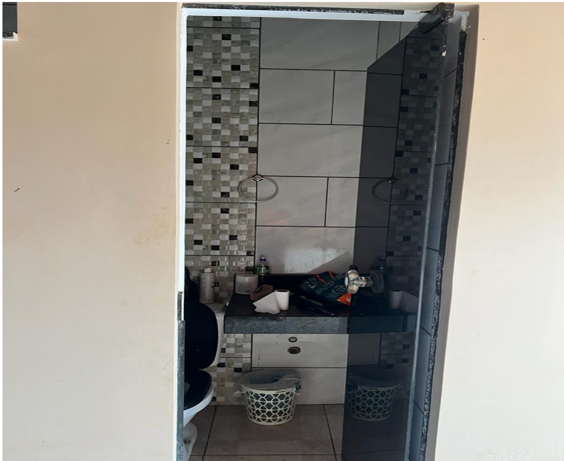
Banheiro e suíte principal