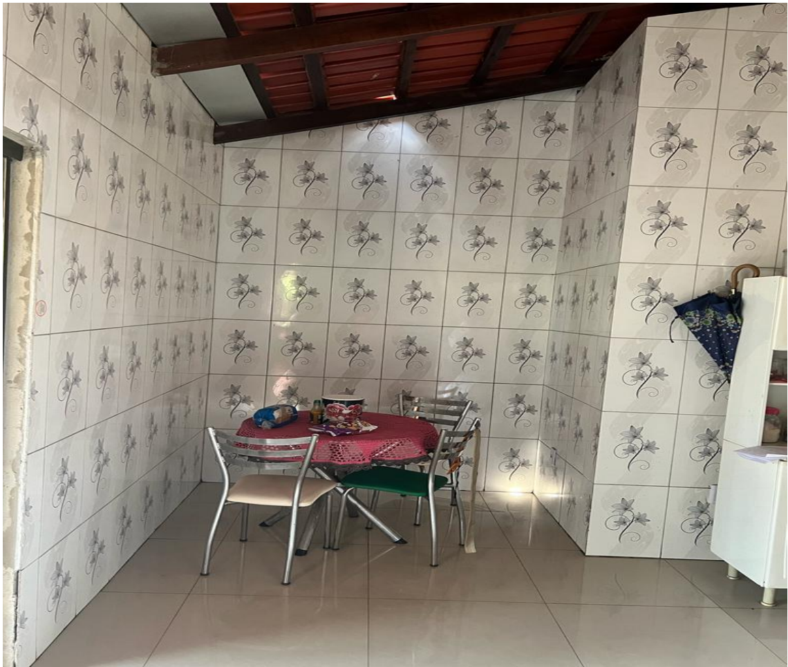
Área de Serviço