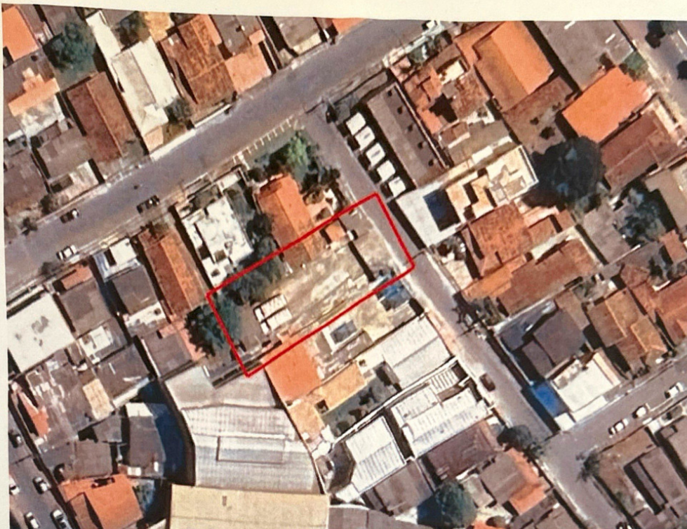
Figura 02: imagem satélite do lote.