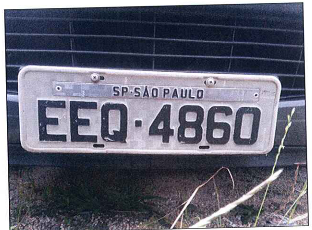
Imagem 2: Placa.