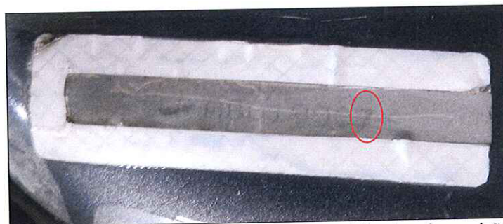
Imagem 7: Etiqueta do compartimento do motor com vestígios de sobreposição de caractere.