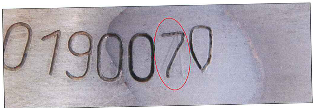
Imagem 5: Caractere “4” revelado sob o número “7”.