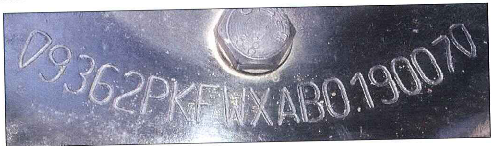
Imagem 3: Numeração do chassi conforme se apresentava.