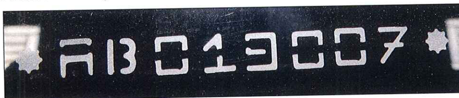
Imagem 7: Numeração de vidro.