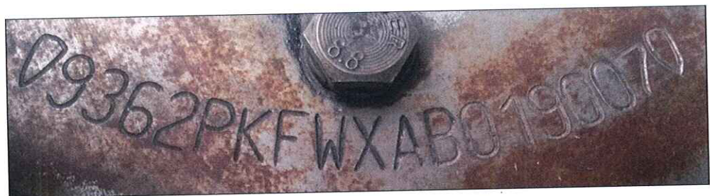
Imagem 4: Numeração do chassi após a remoção da tinta.