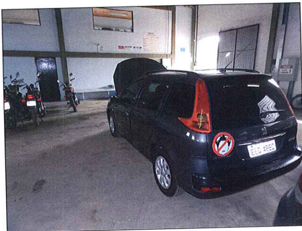
Imagem 1: Veículo examinado.

Tratava-se de um veículo tipo automóvel, espécie passageiro, da marca Peugeot, modelo 207 SW, de cor cinza, portando placas EEQ-4860, de São Paulo – SP.