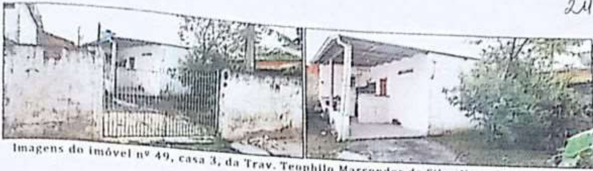
Imagens do imóvel nº 49, casa 3, da Trav. Teophilo Marcondes da Silva Neto, Pereque Mirim