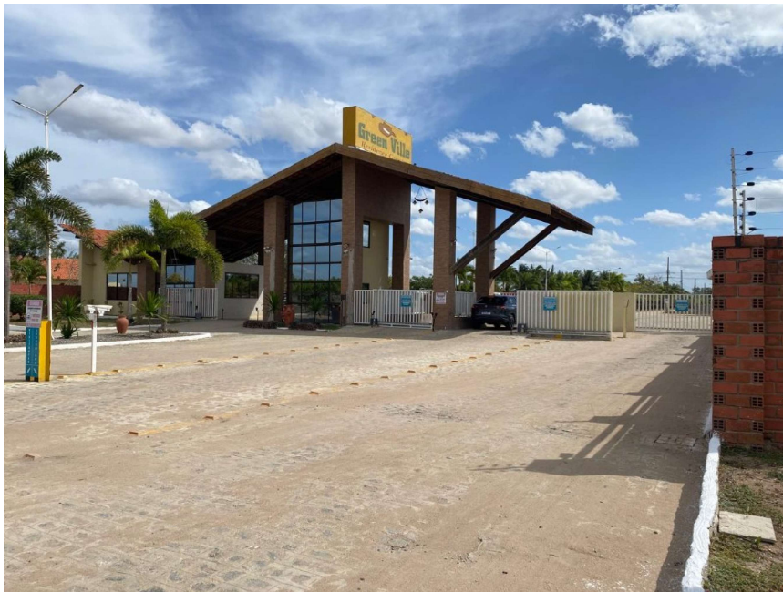
Entrada e portaria do Condomínio Green Ville Residence Country