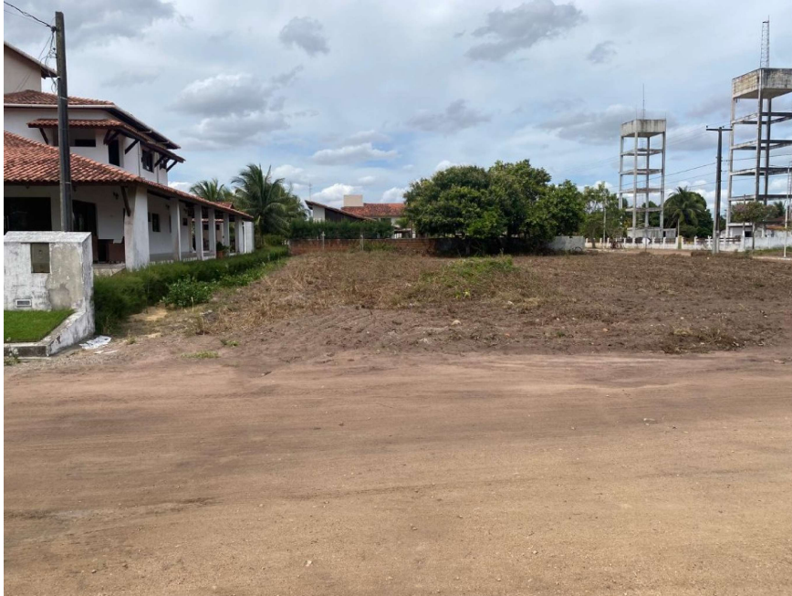
Vista frontal do lote