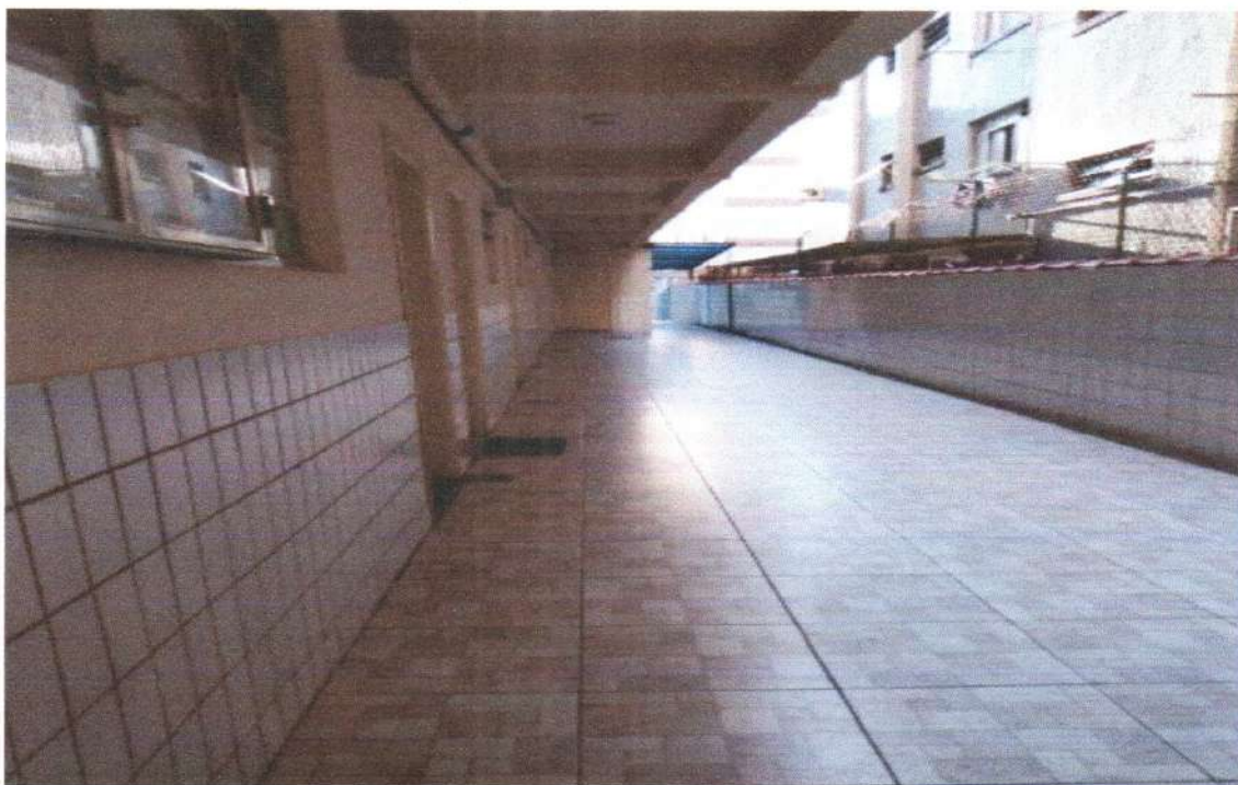
ÁREA COMUM EXTERNA