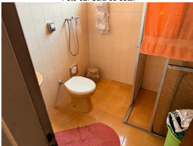
Foto 03. Banheiro