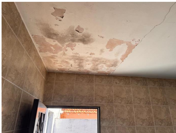
Foto 06. Infiltração d'água no teto do cozinha