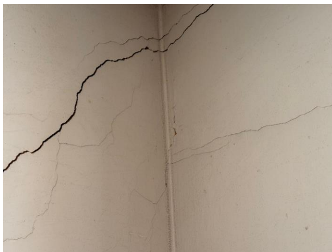
Foto 05. Trincas em parede recalque de fundação