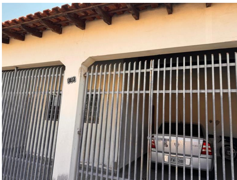
Foto 01. Elevação principal do imóvel.