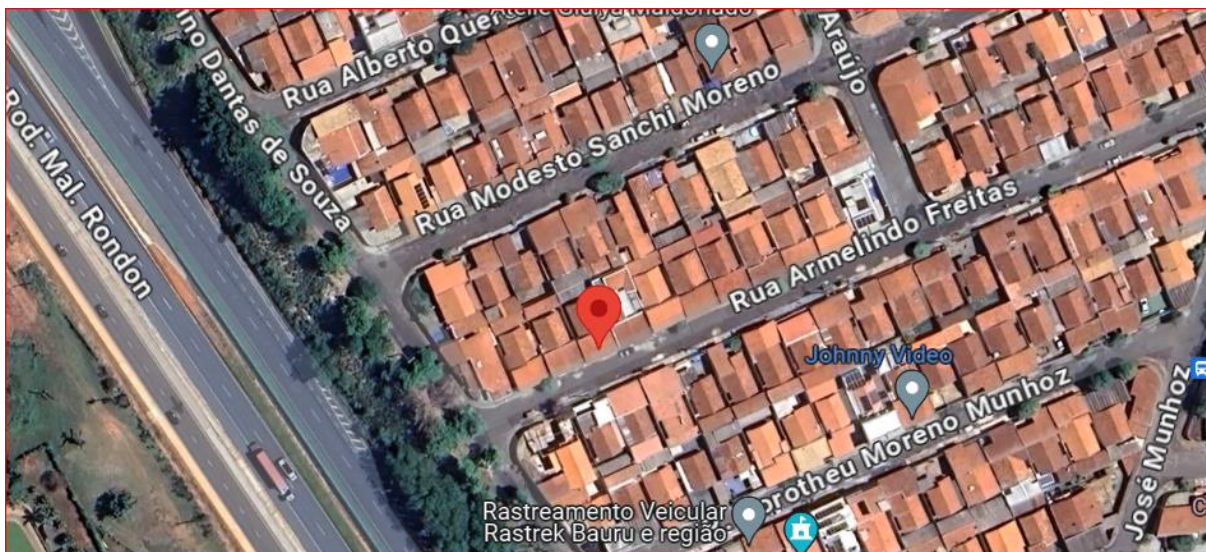
Figura 02. Imagem Google. Localização Rua Armelindo Freitas, nº 1-31, Parque Residencial Jardim Araruna.