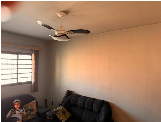
Foto 02. Sala de estar