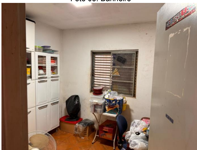
Foto 04. Dormitório