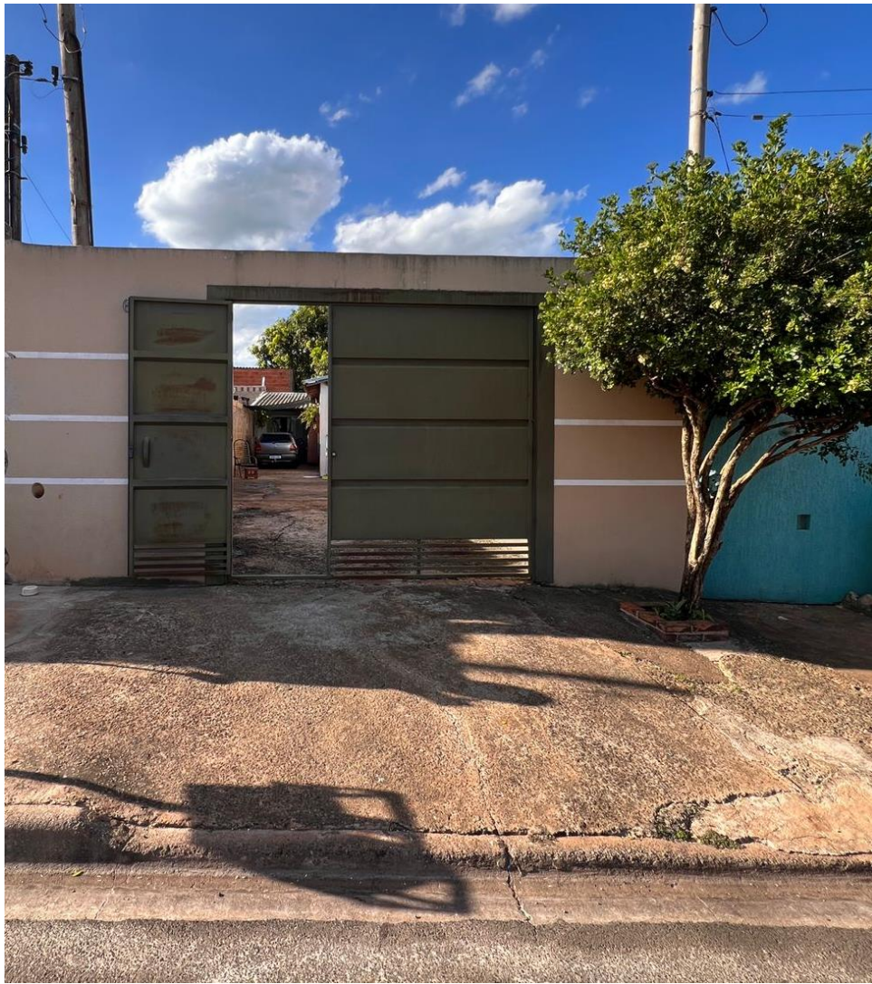
Foto de vistoria in loco realizada em 15/12/2023.