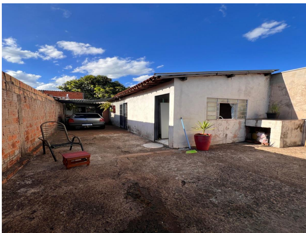
Foto de vistoria in loco realizada em 13/12/2023.