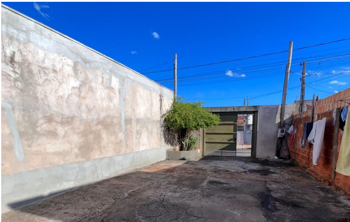
Foto de vistoria in loco realizada em 15/12/2023.