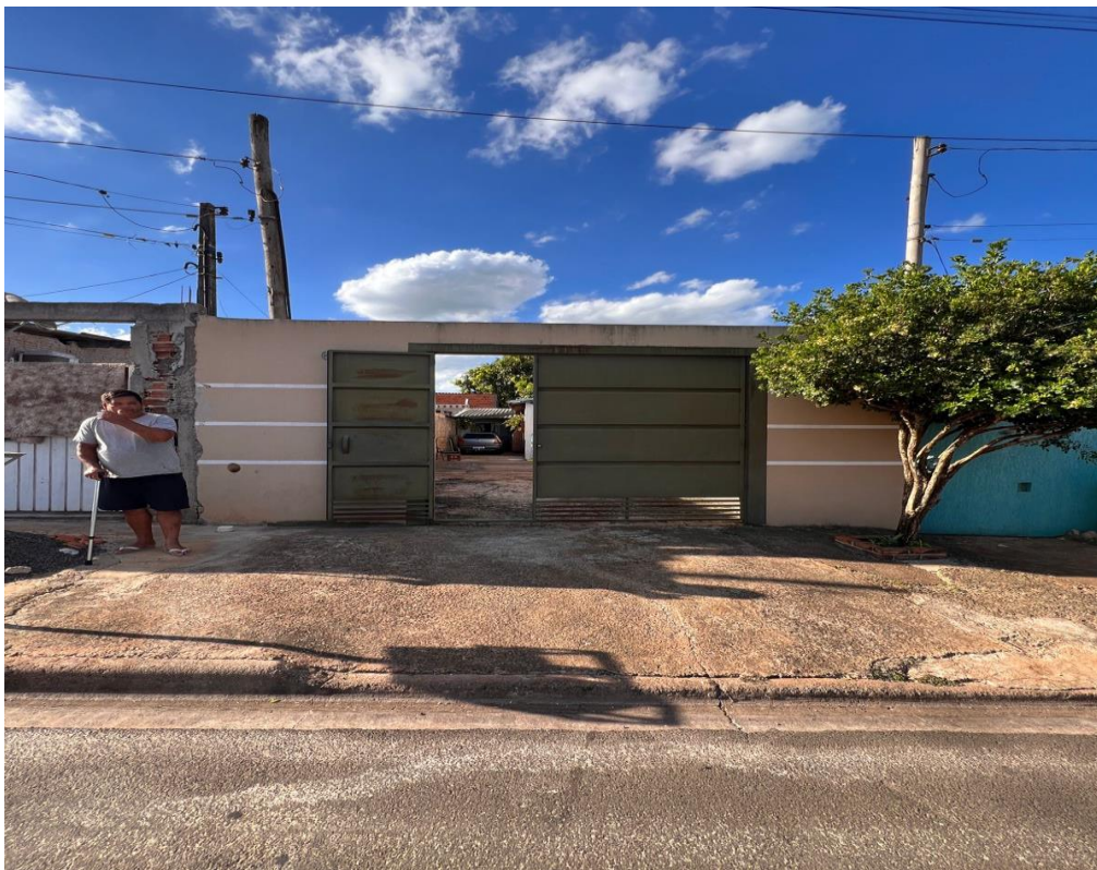
Foto de vistoria in loco realizada em 13/12/2023