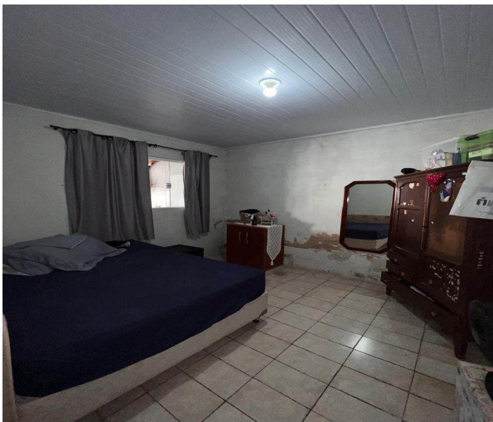
Foto de vistoria in loco realizada em 13/12/2023.