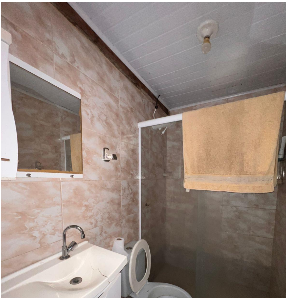
Foto de vistoria in loco realizada em 15/12/2023.