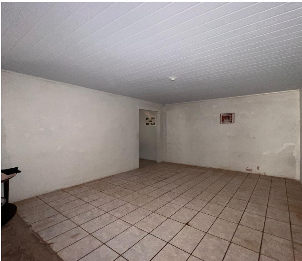
Foto de vistoria in loco realizada em 13/12/2023.