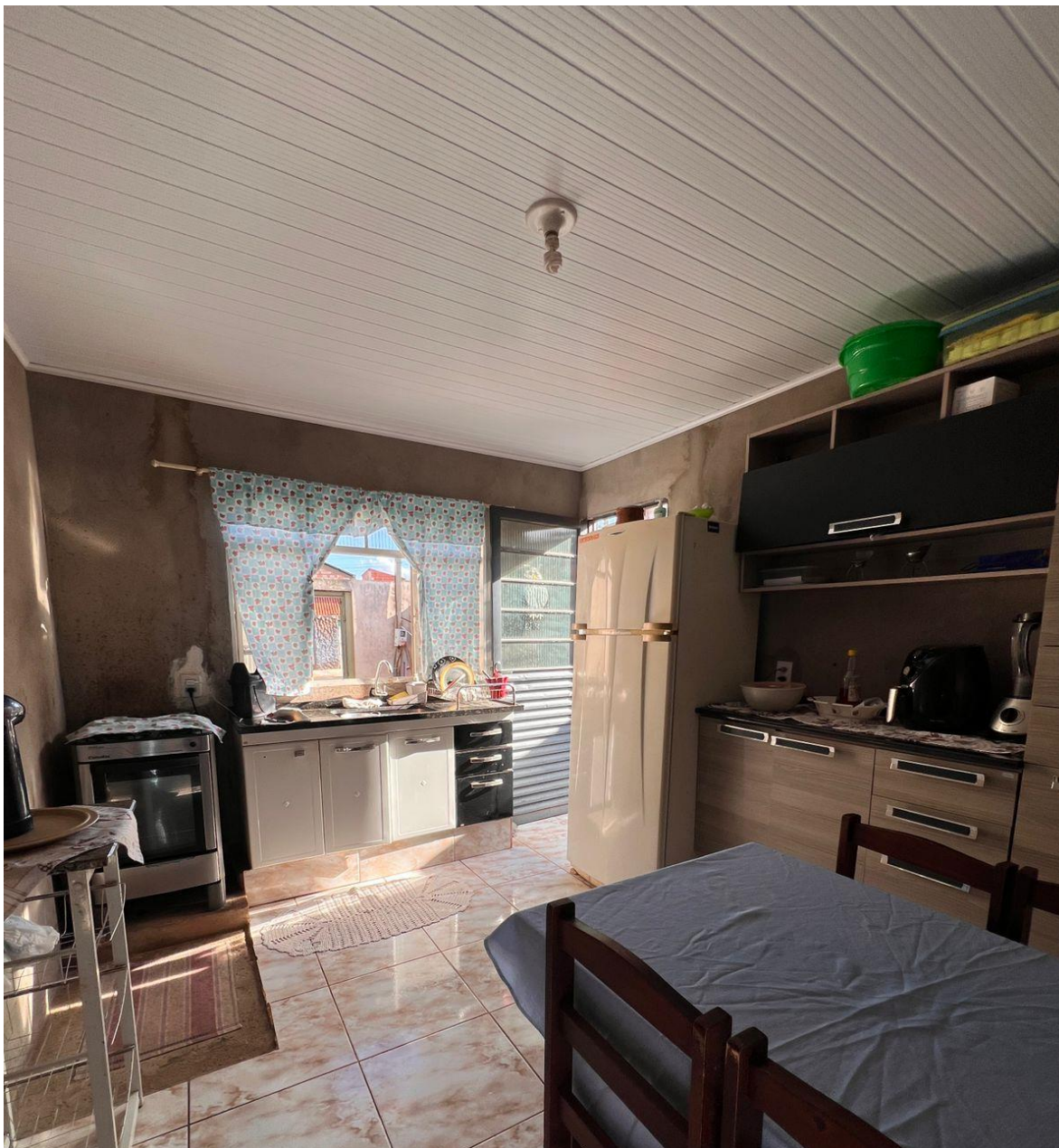
Foto de vistoria in loco realizada em 15/12/2023.