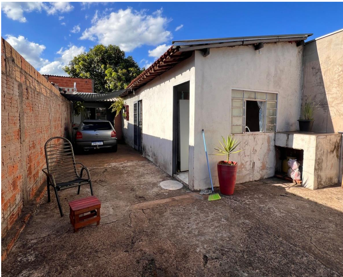
Foto de vistoria in loco realizada em 15/12/2023