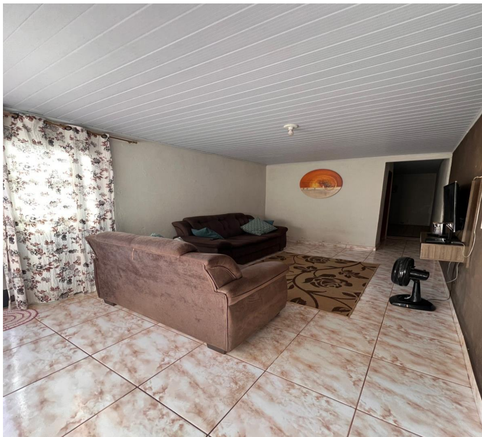
Foto de vistoria in loco realizada em 13/12/2023.