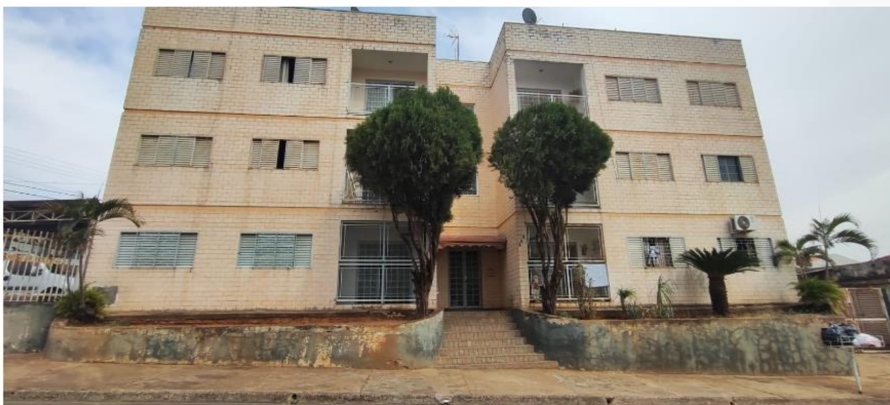
Vista Frontal do Imóvel Avaliado