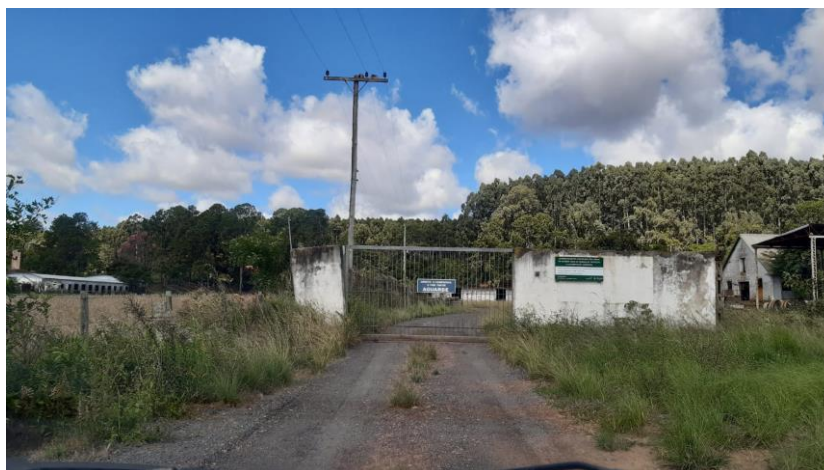
Img. 1: Entrada da propriedade

De acordo com a solicitação de V.Sa, apresentamos a conclusão da avaliação, quanto ao valor do imóvel, situado à (Rodovia RS 401, km 08 – Charqueadas/RS), descrito abaixo: