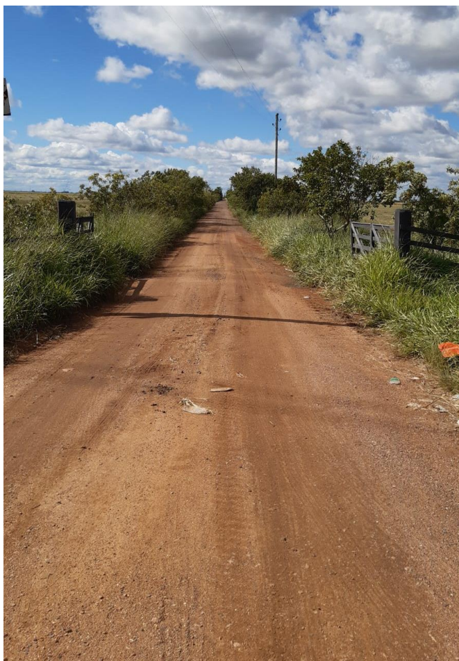
Img. 4 – Acesso rodovia

O acesso à propriedade, correlacionado com a rodovia RS 401, é facilitado, possuindo ligação direta com a mesma, como mostra imagem abaixo.