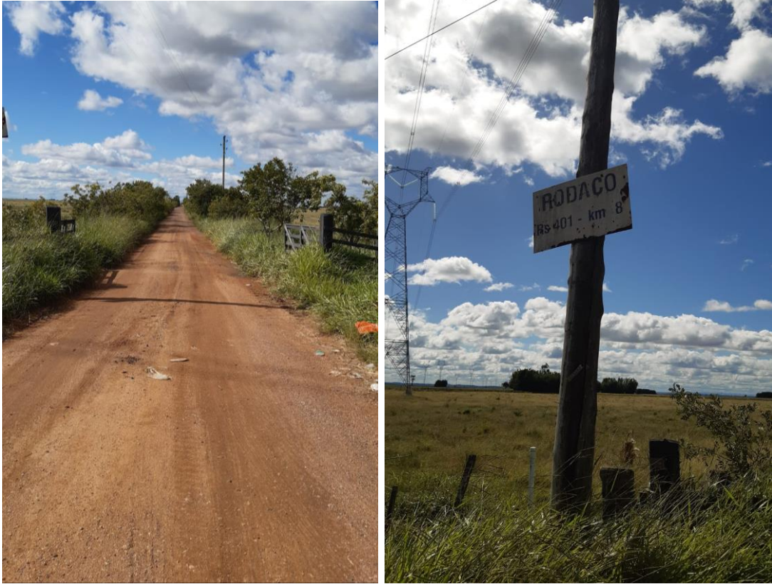
Fig. 3 e 4: Acesso da rodovia.