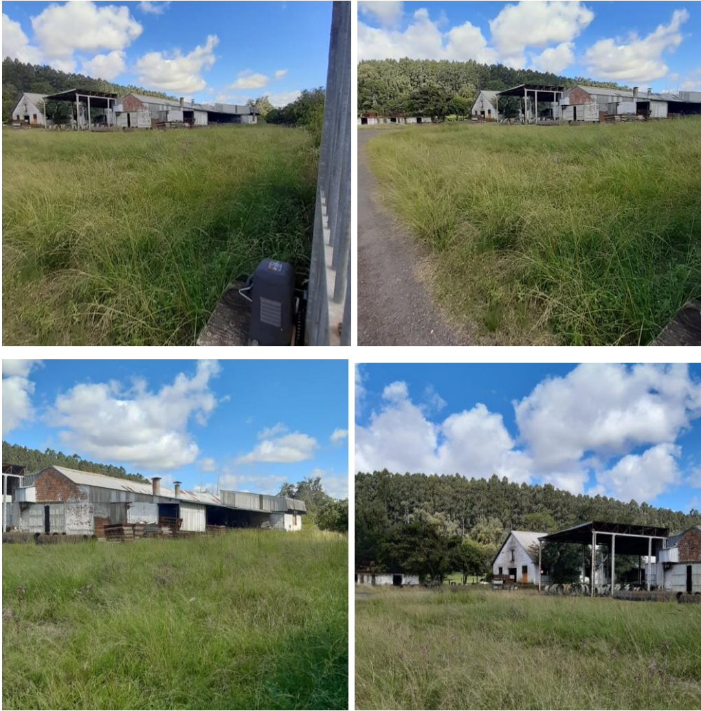
Fig. 7, 8, 9 e 10: Fotos internas.

Avaliação Comercial: A área descrita acima trata-se de uma área rural com benfeitorias, servindo para fabricação de rodas para caminhões, o acesso é facilitado, pois fica bem próximo da rodovia, somando à localização privilegiada, onde ligam as cidades de Charqueadas e Guaíba, possuindo bem feitorias, mais especificamente, três galpões industriais, imóvel este caracterizado pela matrícula de número 32.386 do livro n. 2 do Registro de Imóveis da Comarca de Guaíba/RS, sendo assim, avalio o bem em R$ 560.000,00(Quinhentos e sessenta mil reais).