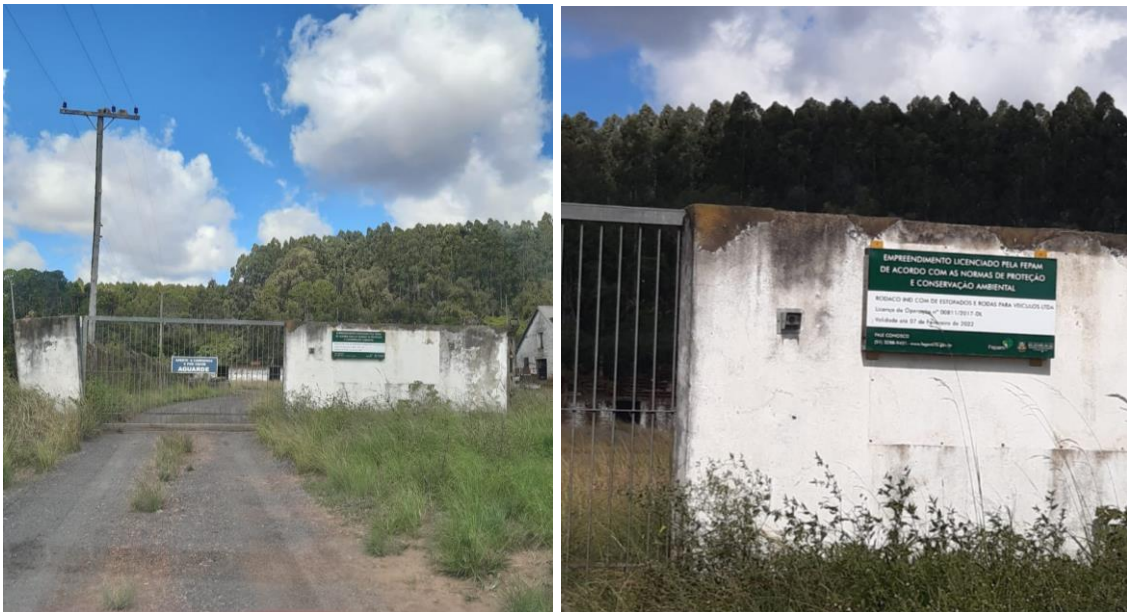
Fig. 5 e 6: Fachada da empresa.