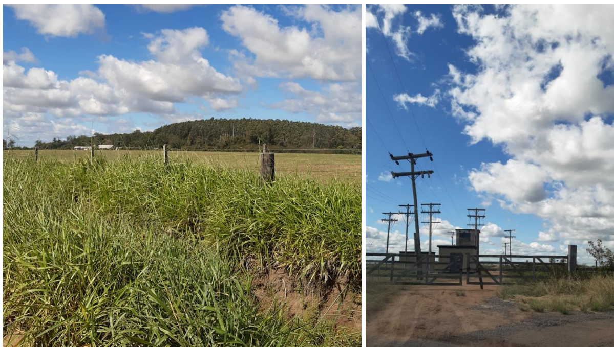
Img. 2 / 3 – Plantações e Estação Elétrica

Trata-se de um imóvel de Área rural/Industrial composto por 27ha (aproximadamente), possuindo três edificações caracterizadas como galpões, usado atualmente para construção de equipamentos rodoviários, o entorno do imóvel é caracterizado por plantações e uma estação elétrica, conforme imagens abaixo: