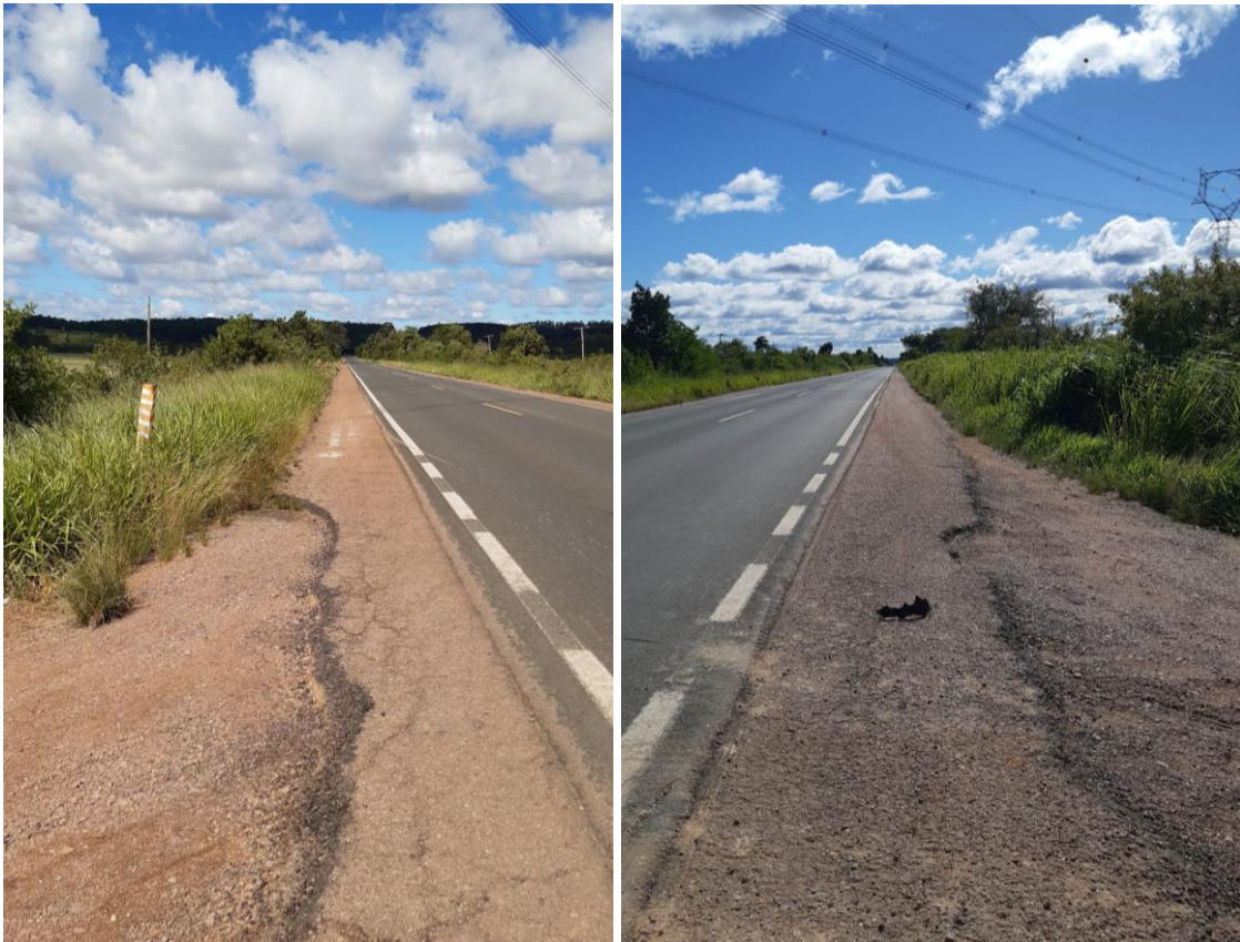
Fig. 1 e 2: Rodovia RS 401, km 08 – Charqueadas.