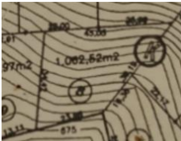
Lote de terreno, sob o nº 08 das Quadra K do loteamento Jardim Ribeirão II - Itupeva/SP, área de 1.062,52m 2 - matrícula 121.041 do 1º CRI de Jundiá

No presente caso, o imóvel penhorado é irregular , como foto da planta do loteamento abaixo, a área um pouco menor, por isso tem seu valor comercial é reduzido .